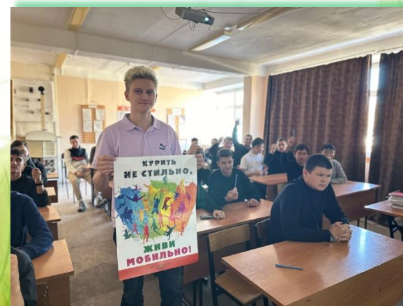
ГБПОУ ИО «Иркутский колледж автомобильного транспорта и дорожного строительства»