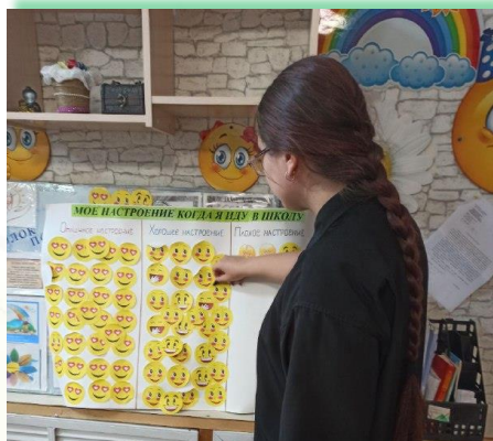
Муниципальное образование Иркутской области «Казачинско-Ленский район»