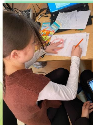
ГАПОУ ИО «Иркутский колледж экономики, сервиса и туризма»