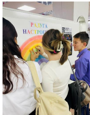
ЧОУ «РЖД лицей № 13» г. Вихоревка