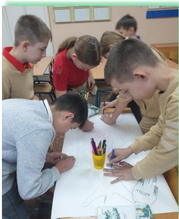
ФГКОУ «Средняя общеобразовательная школа № 178»