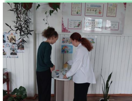
Муниципальное образование «Братский район»