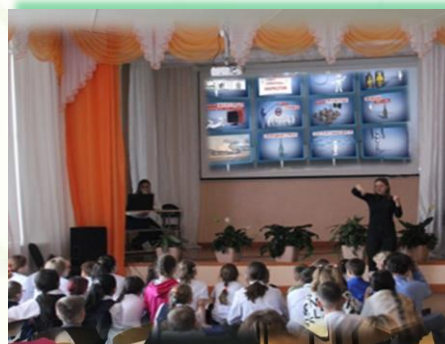
ГОКУ ИО «СКШИ для обучающихся с нарушениями слуха № 9 г. Иркутска»