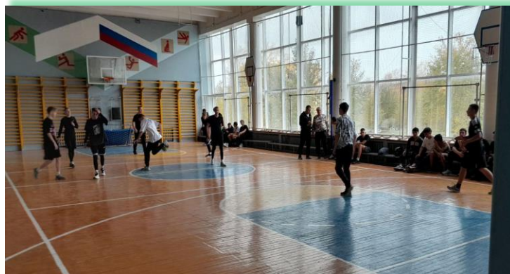
ГАПОУ ИО «Братский индустриально-металлургический техникум»