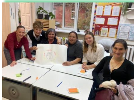
ГОКУ ИО «СКШ № 14 г. Иркутска»