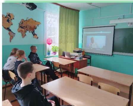
Муниципальное образование Балаганский район