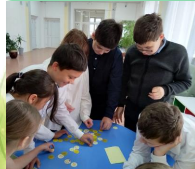
ГОКУ ИО «СКШ № 5 г. Иркутска»