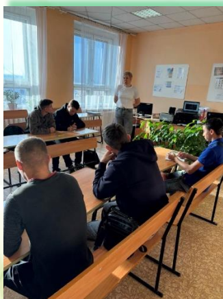
ГБПОУ ИО «Усольский аграрно – промышленный техникум»