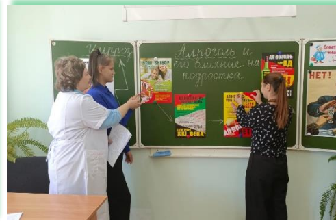
ГОКУ ИО «СКШИ г. Саянска»