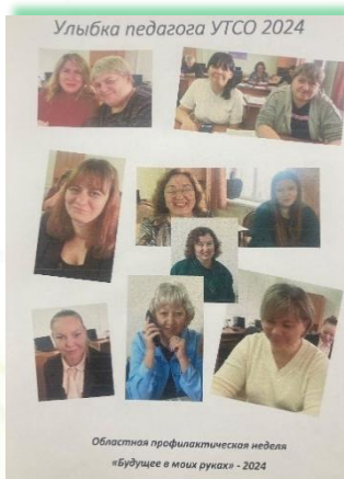
ГБПОУ ИО «Усольский техникум сферы обслуживания»