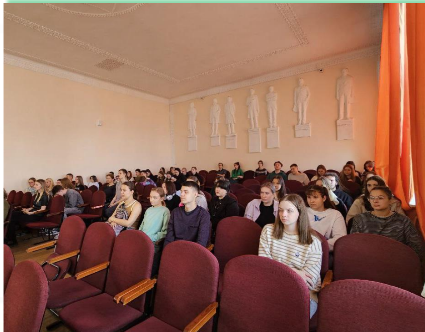
ГБПОУ ИО «Братское музыкальное училище»