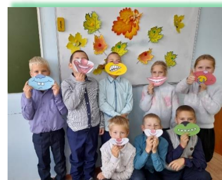
Усольское районное муниципальное образование