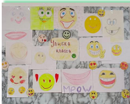
Ольхонское районное муниципальное образование