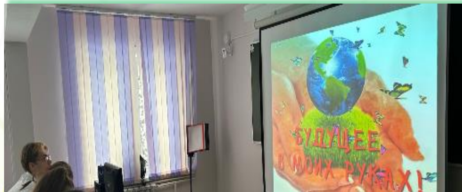
ОГБПОУ «Саянский медицинский колледж»