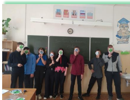
ГОКУ ИО «Специальная (коррекционная) школа № 1 г. Усьолье-Сибирское»