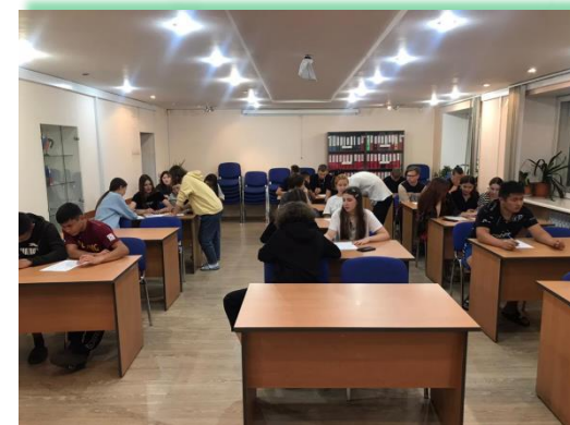
ГБПОУ ИО «Иркутский техникум архитектуры и строительства»