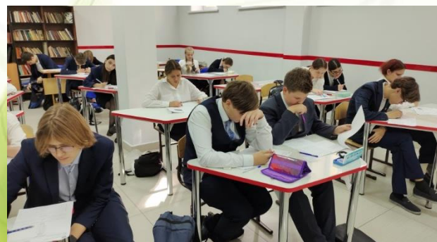
ЧОУ «РЖД лицей № 14» г. Иркутск