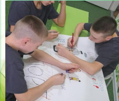
ГСУБОУ «Специальная (коррекционная) общеобразовательная школа» г. Ангарск