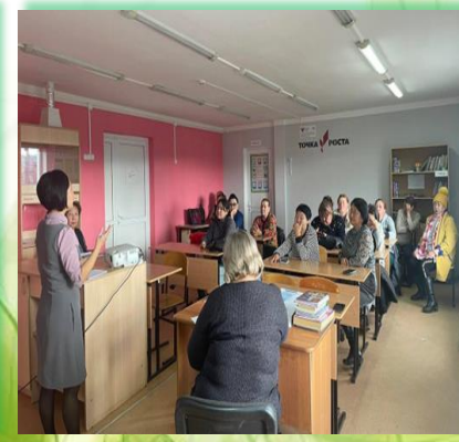
Муниципальное образование «Эхирит-Булагатский района»