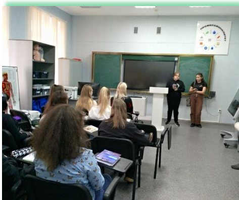
ГБПОУ ИО «Ангарский педагогический колледж»