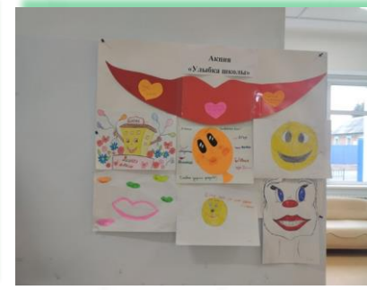
ГОКУ ИО «СКШ р.п. Усть-Уда»