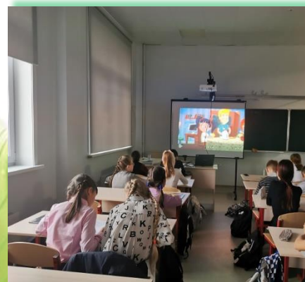
Зиминское городское муниципальное образование