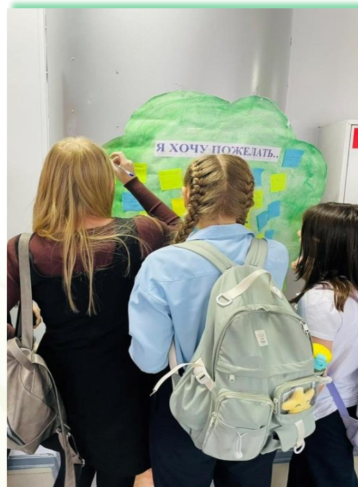
ЧОУ РЖД Лицей №13