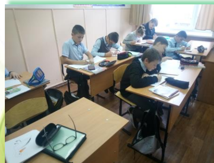
ГОКУ ИО «Специальная (коррекционная) школа № 11 г. Иркутска»