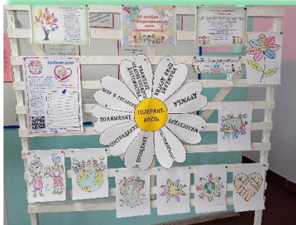
Муниципальное образование «Нижнеудинский район»