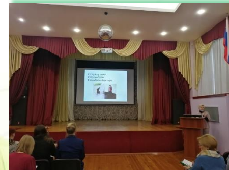
ЧОУ РЖД Лицей №14