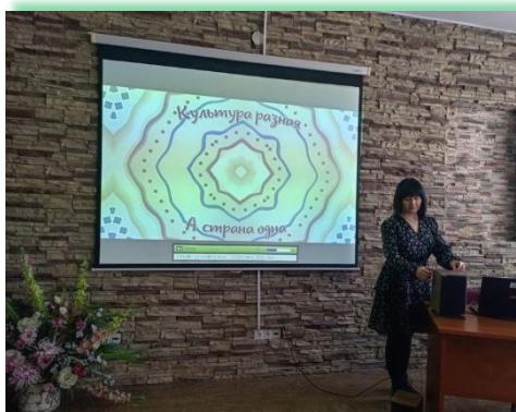
ГАПОУ ИО «Ангарский техникум строительных технологий»