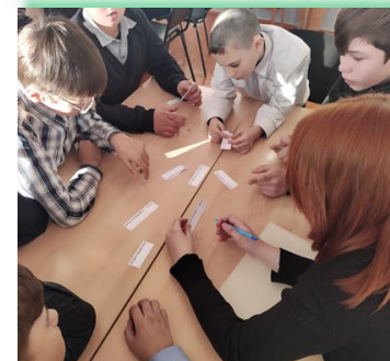
ГОКУ ИО «СКШИ № 19 г. Тайшета»