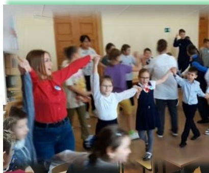
ГОКУ ИО «СКШИ для обучающихся с нарушениями слуха № 9 г. Иркутска»