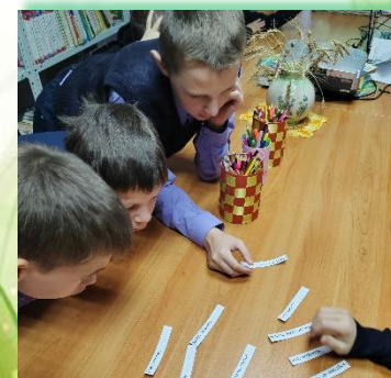
ГОБУ ИО «Специальная (коррекционная) школа- интернат п. Целинные Земли»