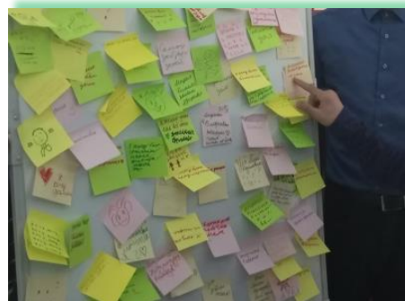
ГОКУ ИО «СКШ № 1 г. Черемхово»