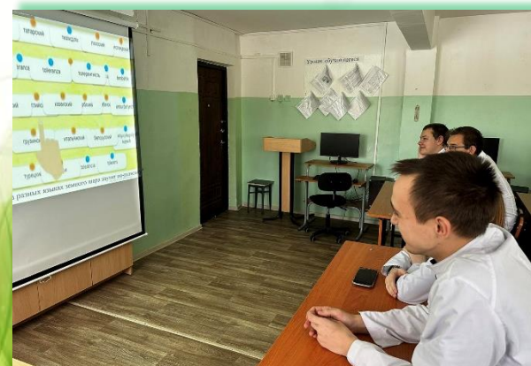
ОГБПОУ «Саянский медицинский колледж»