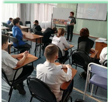
ГОКУ ИО «СКШИ №1 г. Ангарска»