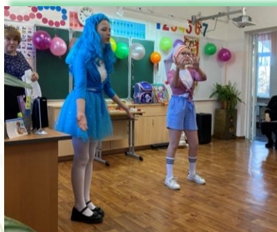
ГОКУ ИО «СКШИ для обучающихся с нарушениями зрения № 8 г. Иркутска»