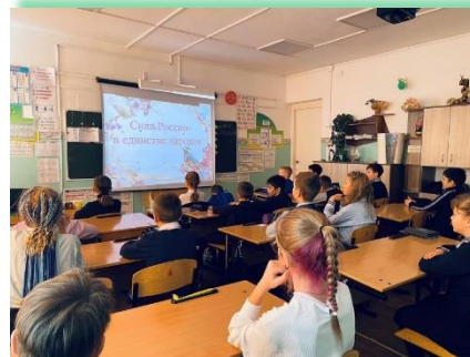
Иркутское районное муниципальное образование