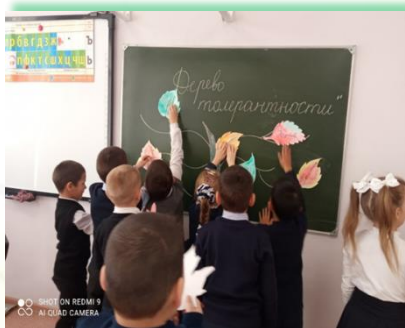
Районное муниципальное образование «Усть- Удинский район»