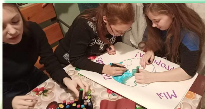
ГАПОУ ИО «Байкальский техникум отраслевых технологий и сервиса»