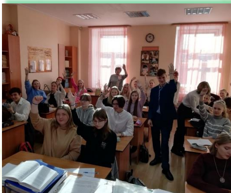
ГБПОУ ИО «Иркутский техникум архитектуры и строительства»