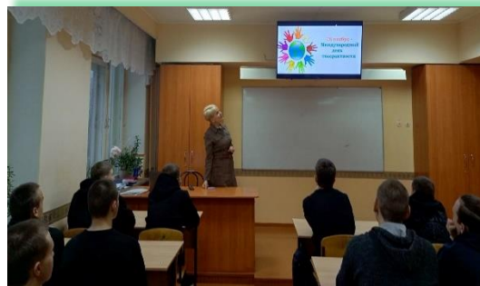
ГАПОУ ИО «Братский индустриально-металлургический техникум»