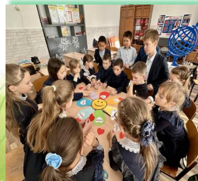
Муниципальное образование «Боханский район»