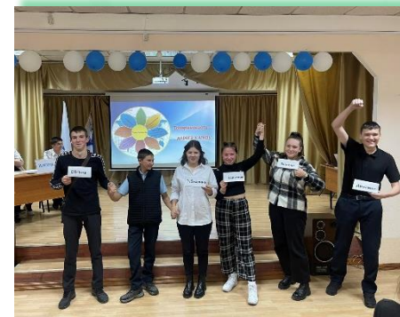
ГБПОУ ИО «Иркутский техникум речного и автомобильного транспорта»