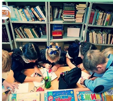
Зиминское городское муниципальное образование