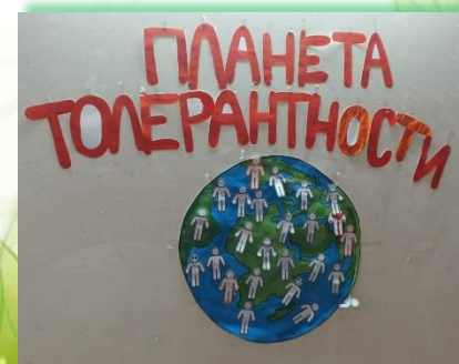
Муниципальное образование г. Бодайбо и района