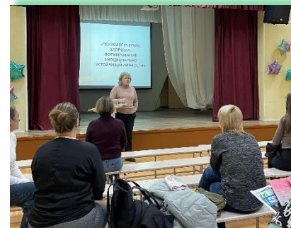
Муниципальное образование «Ангарский городской округ»