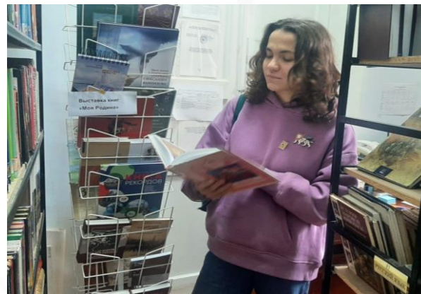
ГБПОУ «Иркутский областной художественный колледж им. И. П. Копылова»