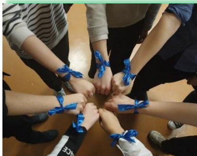
Муниципальное образование «Эхирит-Булагатский»