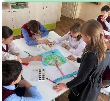
ГОКУ ИО «Специальная (коррекционная) школа № 14 г. Иркутска»