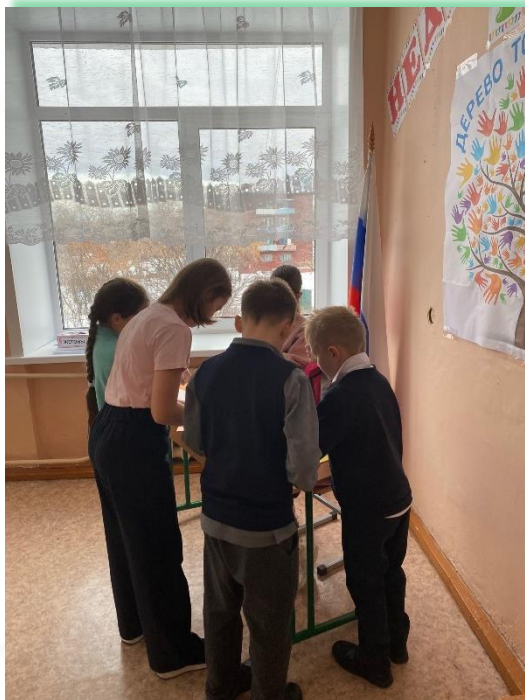
ФГКОУ «Средняя общеобразовательная школа № 178»