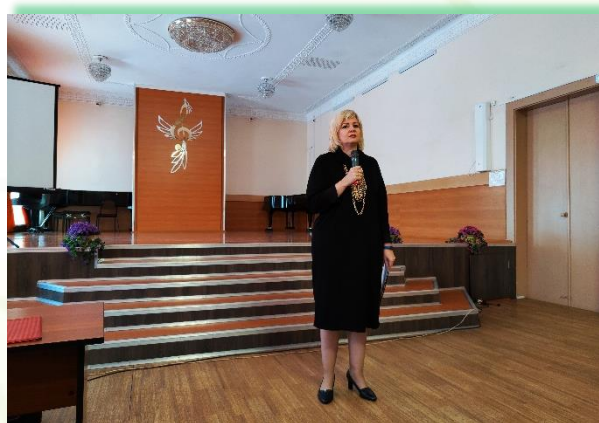
ГБПОУ ИО «Братское музыкальное училище»