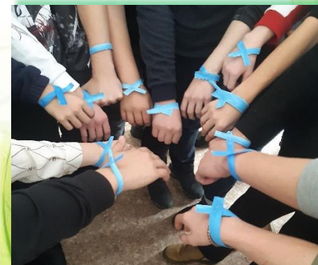
ГБПОУ ИО «Усольский аграрно – промышленный техникум»