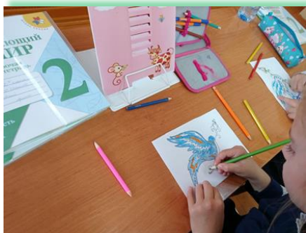
Ольхонское районное муниципальное образование