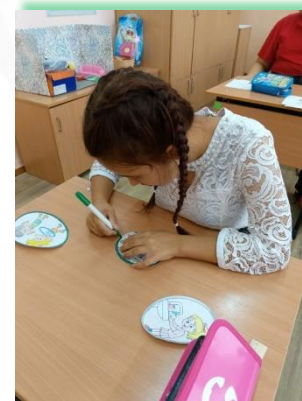
ГОКУ ИО «СКШ № 25 г. Братска»