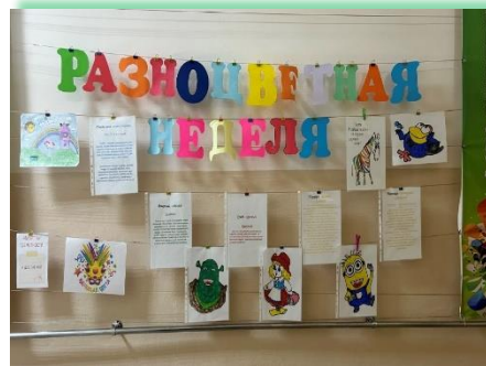
Чунское районное муниципальное образование