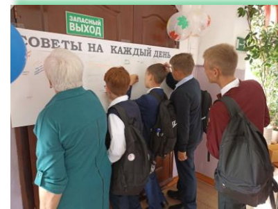
Иркутское районное муниципальное образование