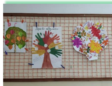
ГОКУ ИО «СКШ № 3 г. Иркутска»