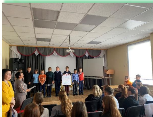
Муниципальное образование «Жигаловский район»