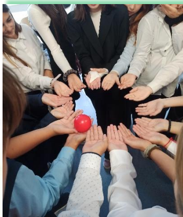
Муниципальное образование «город Саянск»