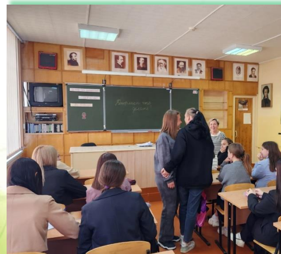
ГАПОУ ИО «Братский индустриально-металлургический техникум»