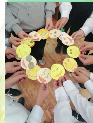
ГОКУ ИО «СКШИ №1 г. Ангарска»