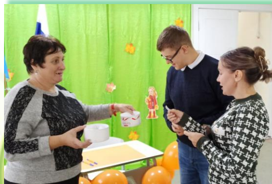
ГОКУ ИО «СКШИ № 6 г. Нижнеудинска»