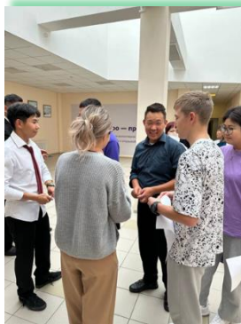
ГОБУ ИО «Усть-Ордынская гимназия – интернат»