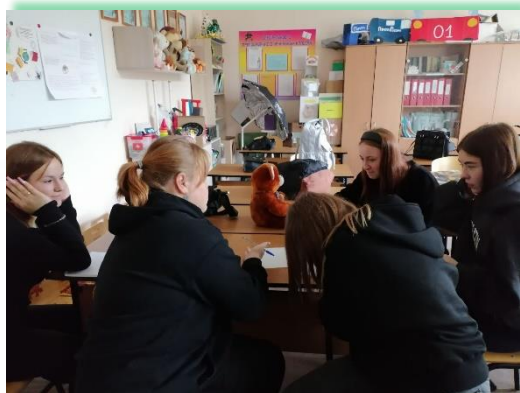
ГБПОУ ИО «Ангарский педагогический колледж»