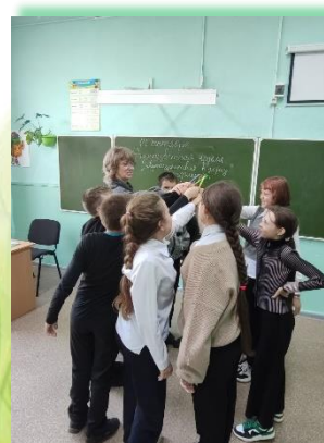
Муниципальное образование «Тайшетский район»