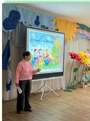
ГОКУ СКШ г. Усть-Илимска