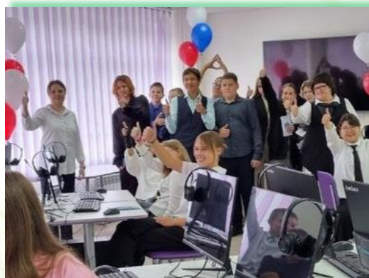
ГБПОУ ИО «Иркутский техникум архитектуры и строительства» Шелеховский район