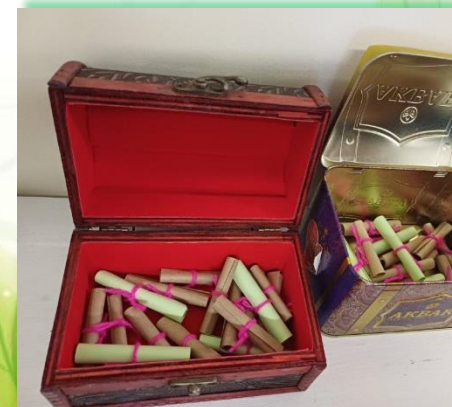
Муниципальное образование «Нукутский район»