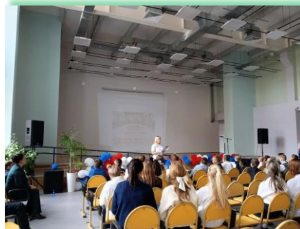
Муниципальное образование «Боханский район»