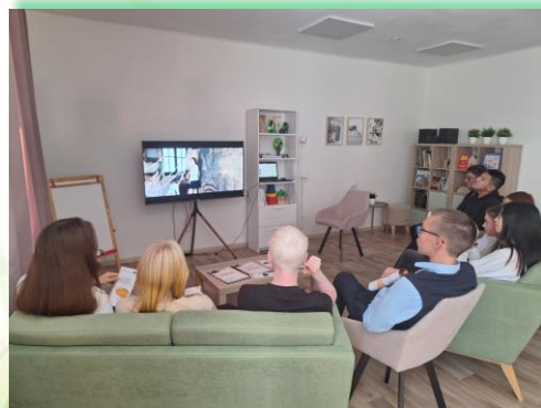
ГОКУ ИО «СКШИ для обучающихся с нарушениями зрения № 8 г. Иркутска»