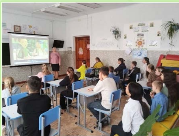
ГОКУ ИО «Специальная (коррекционная) школа № 1 г. Черемхово»