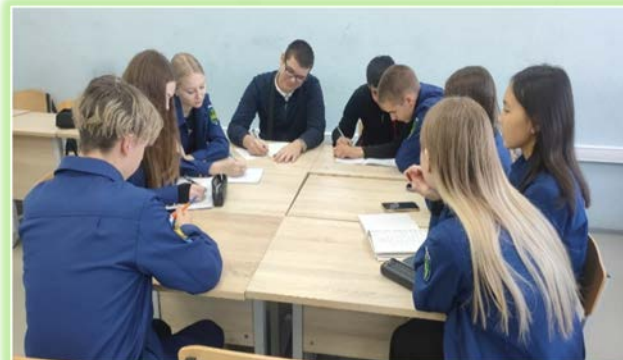
ФГБОУ ВО (Колледж) Иркутский институт (филиал) ФГБОУ ВО «ВГУЮ»