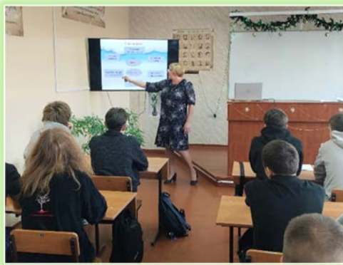
ГАПОУ ИО «Братский индустриально-металлургический техникум»