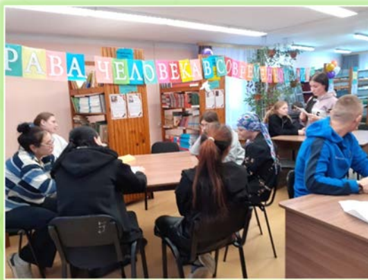
ГАПОУ ИО «Заларинский агропромышленный техникум»