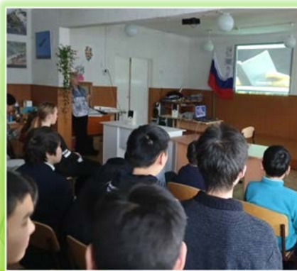
Ольхонское районное муниципальное образование