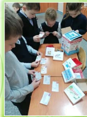
Муниципальное образование - «город Тулун»