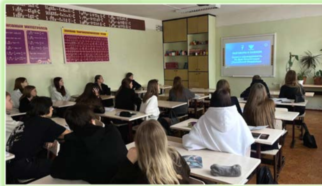
ГБПОУ ИО «Ангарский промышленно-экономический техникум»