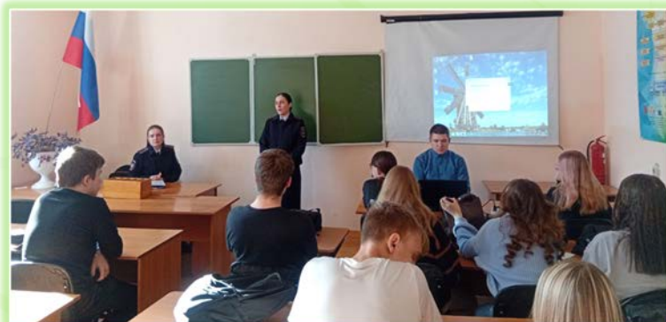
ЧПОУ «Иркутский гуманитарно-технический колледж г. Усть-Кут»