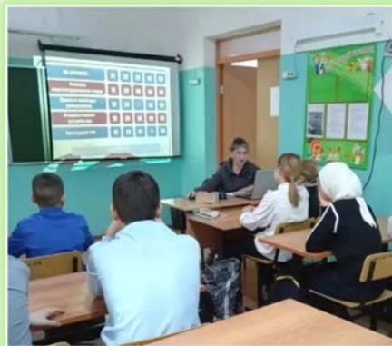
Зиминское городское муниципальное образование