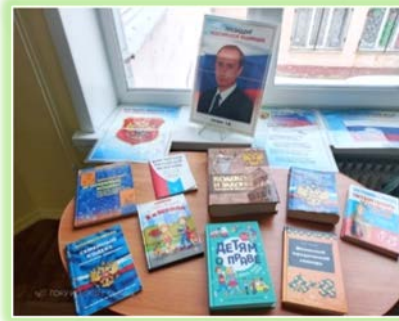
ГОКУ ИО «СКШ г. Саянска»