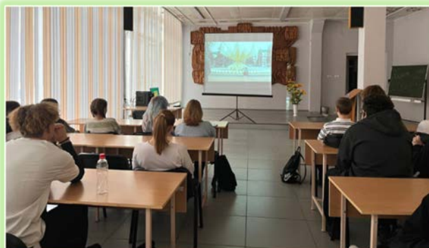
ФГБПОУ «Братский целлюлозно-бумажный колледж»