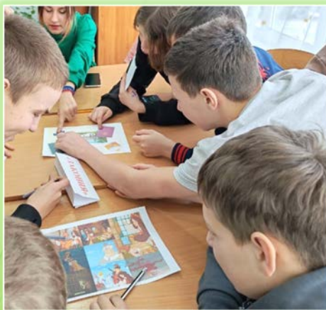
ГОКУ ИО «Специальная (коррекционная) школа № 3 г. Тулуна»