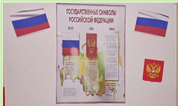
ГБПОУ ИО «Ангарский политехнический техникум»