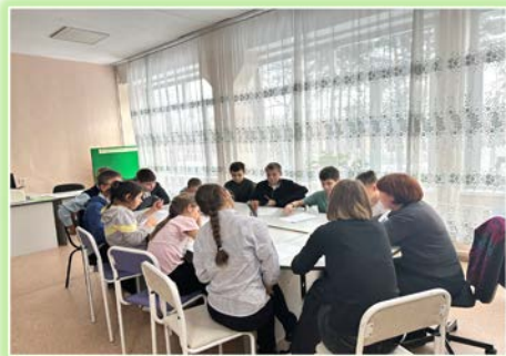
ГОКУ ИО «СКШ № 1 г. Ангарска»