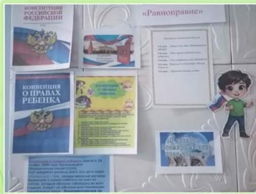
Муниципальное образование Мамско-Чуйского района