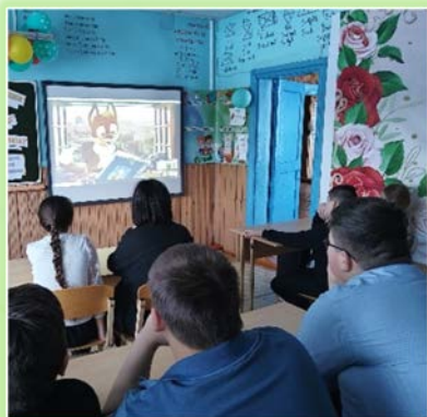
Муниципальное образование «Катангский район»