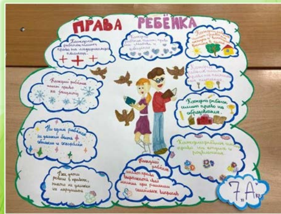
ГОКУ ИО «Специальная (коррекционная) школа № 6 г. Нижнеудинска»