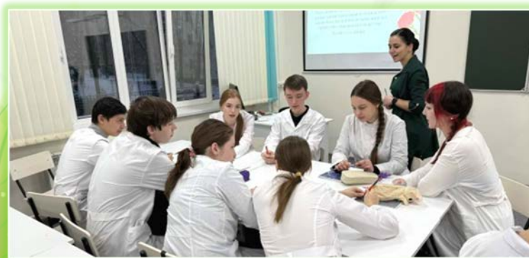
ОГБПОУ ИО «Черемховский медицинский колледж им. Турышевой А.А.»