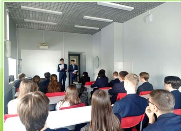
ЧОУ «РЖД лицей № 13» г. Вихоревка