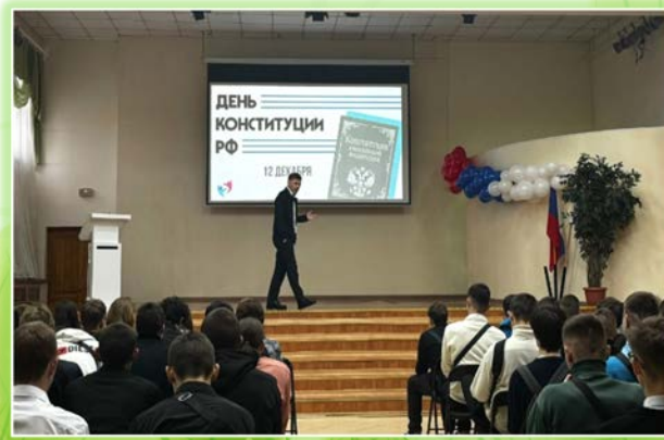
ГБПОУ ИО «Иркутский техникум авиастроения и материалообработки»