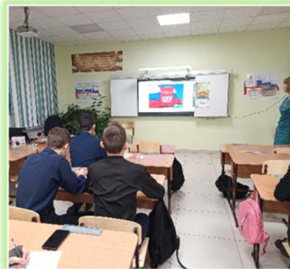
Иркутское районное муниципальное образование