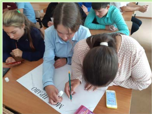
Муниципальное образование «Заларинский район»