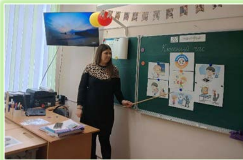
ГОКУ ИО «Специальная (коррекционная) школа г. Вихоревка»