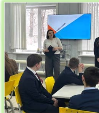
Муниципальное образование «город Усолье- Сибирское»