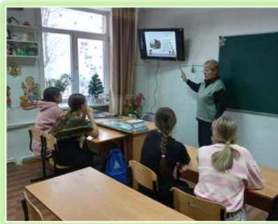
ГОКУ ИО «СКШИ для обучающихся с нарушениями опорно-двигательного аппарата № 20 г. Иркутска»