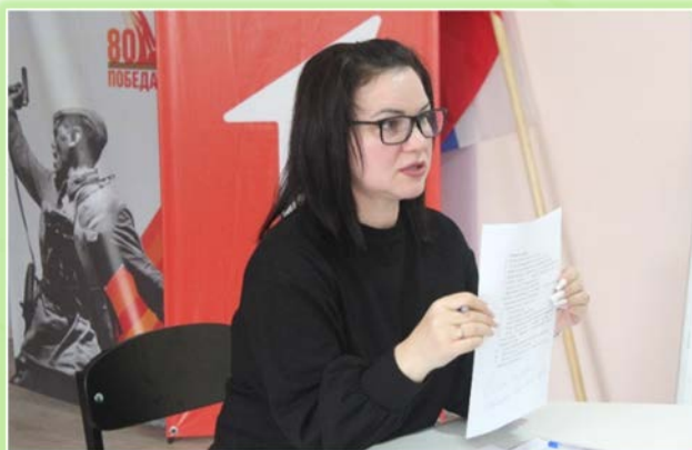
ГАБПОУ ИО «Нижеудинский техникум железнодорожного транспорта»