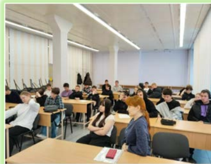
ФГБПОУ «Братский целлюлозно-бумажный колледж»