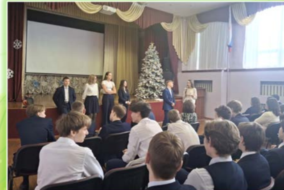
ЧОУ «РЖД лицей № 13» г. Вихоревка