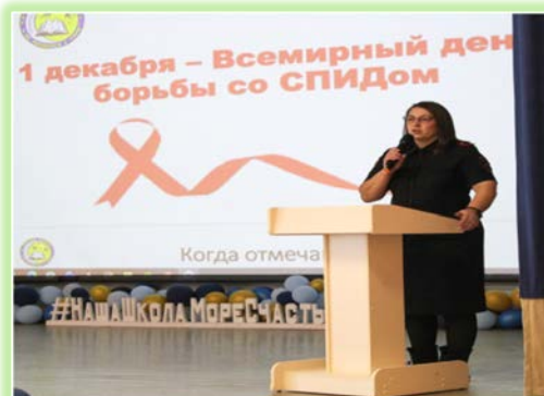
Муниципальное образование «город Свирск»