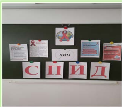
Муниципальное образование «Боханский район»