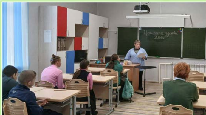
ГОКУ ИО «Специальная (коррекционная) школа г. Вихоревка»