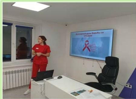
ОГБПОУ ИО «Братский медицинский колледж»