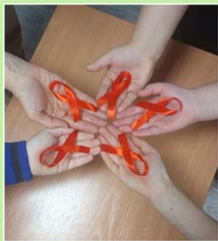
ГОКУ ИО «СКШ г. Киренска»