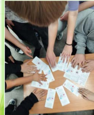
Чунское районное муниципальное образование