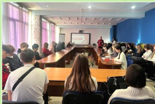
ГАПОУ ИО «Иркутский технологический колледж»