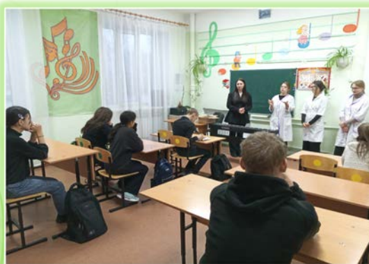
ГОКУ ИО «Специальная (коррекционная) школа № 6 г. Нижнеудинска»