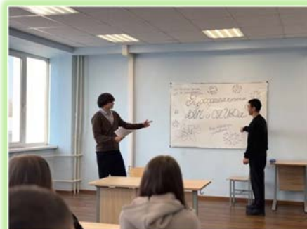
ФГБОУ ВО (Колледж) Иркутский институт (филиал) ФГБОУ ВО «ВГУЮ»