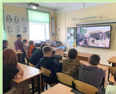
Муниципальное образование «Жигаловский район»