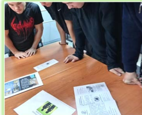
ГБПОУ ИО «Черемховский техникум промышленной индустрии и сервиса»