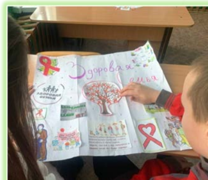
Муниципальное образование «Тайшетский район»