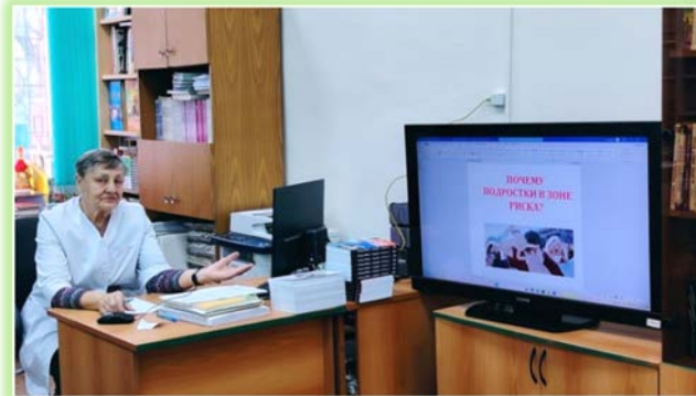
ГОКУ ИО «СКШИ для обучающихся с нарушениями зрения №8 г. Иркутска»