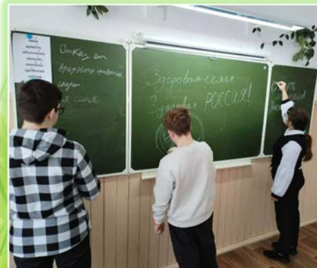
Муниципальное образование «Братский район»