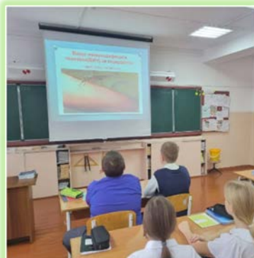
Муниципальное образование «Нижнеилимский район»