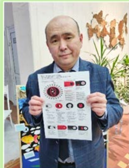
ГОКУ ИО «СКШ № 5 г. Иркутска»