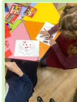
ГОКУ ИО «СКШ № 14 г. Иркутска»