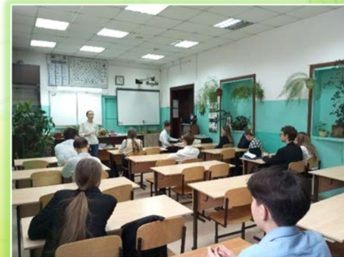
ГНОБУ ИО «Школа-интернат музыкантских воспитанников г. Иркутска»