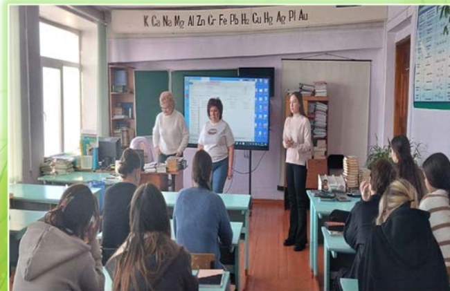
ГБПОУ ИО «Тулунский аграрный техникум»