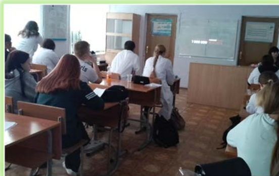
ОГБПОУ ИО «Нижнеудинский медицинское училище»