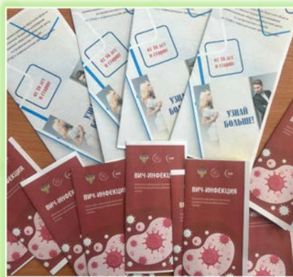
Муниципальное образование «Нукутский район»