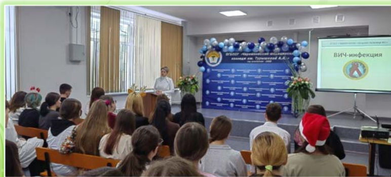
ОГБПОУ ИО «Черемховский медицинский колледж им. Турышевой А.А.»