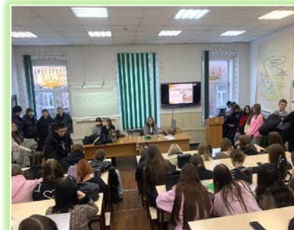
ЧПОУ «Байкальский колледж права и предпринимательства»