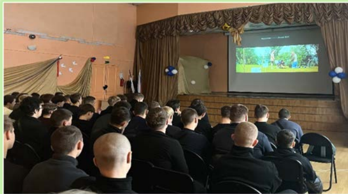
ГБПОУ ИО «Зиминский железнодорожный техникум»