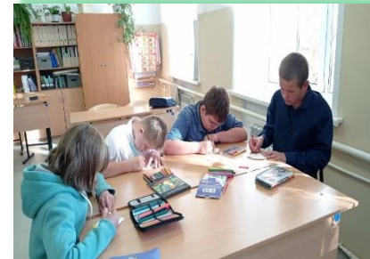
ГОКУ ИО «СКШИ № 19 г. Тайшета»