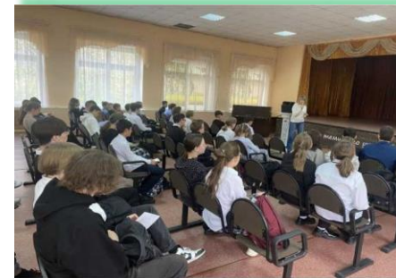
Муниципальное образование «Ангарский городской округ»