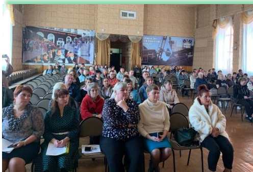
ГБПОУ ИО «Черемховский горнотехнический колледж им. М.И. Щадова»