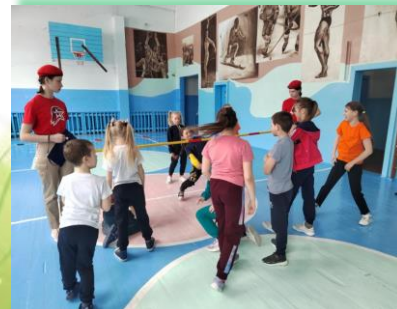
Муниципальное образование «Братский район»