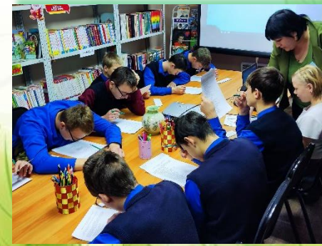
ГОБУ ИО «Специальная (коррекционная) школа-интернат п. Целинные Земли»