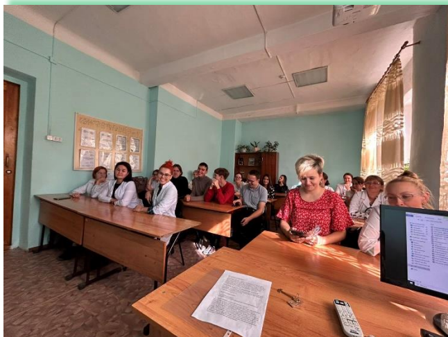
ОГБПОУ «Черемховский медицинский техникум им. Туршевой А.А.»