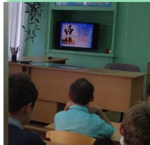
ГОКУ ИО «Специальная (коррекционная) школа № 33 г. Братска»