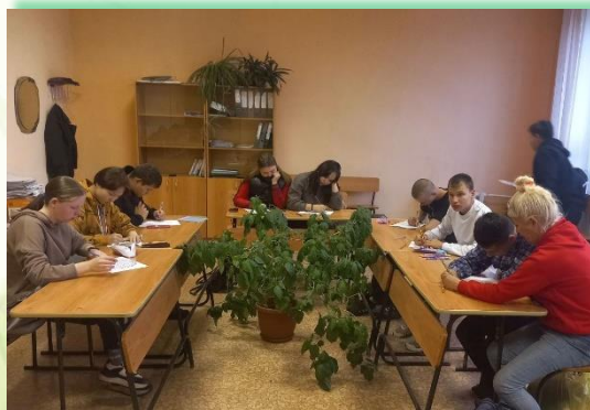
ГБПОУ ИО «Усольский аграрно – промышленный техникум»