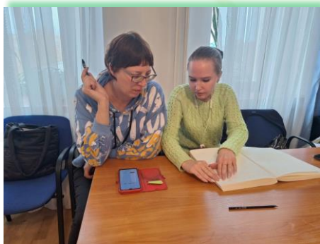
ГОКУ ИО «СКШИ для обучающихся с нарушениями зрения № 8 г. Иркутска»