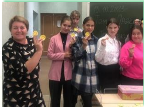
ГБПОУ ИО «Иркутский техникум машиностроения им. Н.П. Трапезникова»