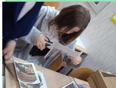
Зиминское районное муниципальное образование