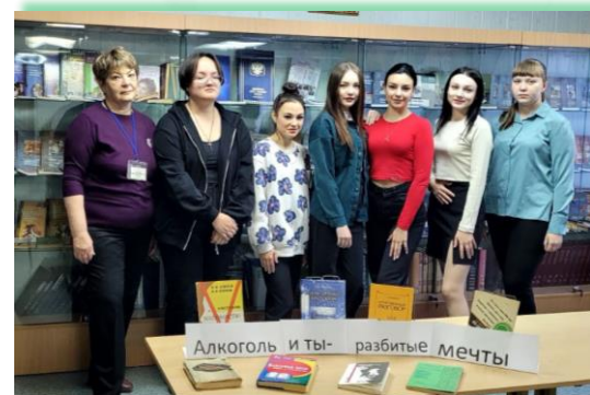
ГАПОУ ИО «Байкальский техникум отраслевых технологий и сервиса»