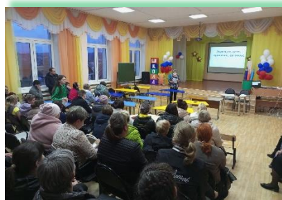
Муниципальное образование «Нижнеудинский район»