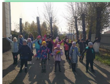
ГОКУ ИО «СКШ № 1 г. Черемхово»