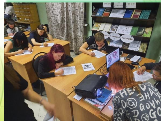
ГБПОУ ИО «Черемховский техникум промышленной индустрии и сервиса»