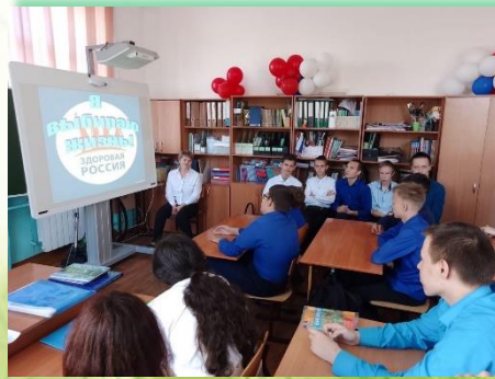
ГОКУ ИО «Специальная (коррекционная) школа № 7 г. Иркутска»