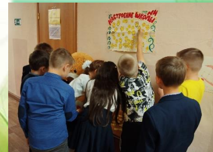
Муниципальное образование г. Бодайбо и района