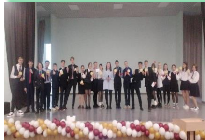
Иркутское районное муниципальное образование