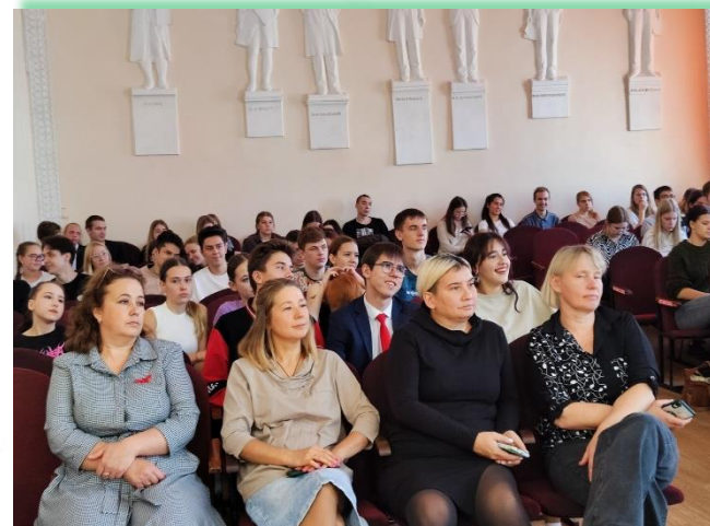
ГБПОУ «Братское музыкальное училище»