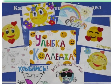
ГБПОУ ИО «Ангарский педагогический колледж»