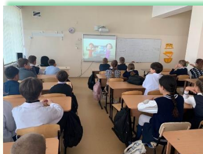
Районное муниципальное образование «Усть- Удинский район»