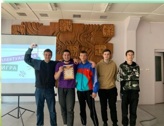
Братский целлюлозно-бумажный колледж ФГБОУ ВО «БГУ»