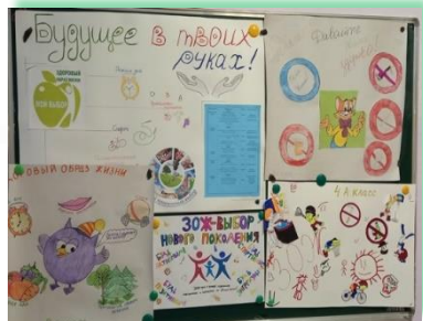
ГОКУ ИО «Специальная (коррекционная) школа г. Вихоревка»