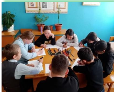
Муниципальное образование «Эхирит-Булагатский»