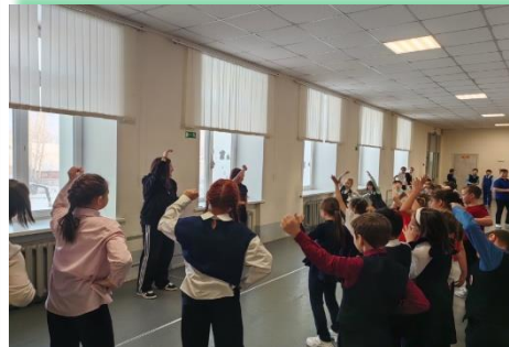
Усть-Кутское муниципальное образование