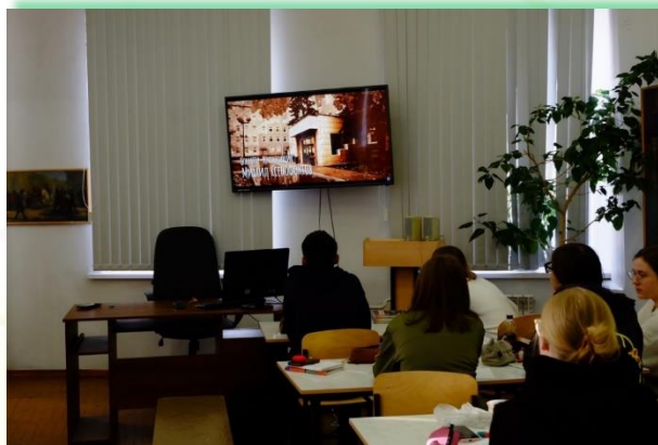
ГБПОУ «Иркутский областной художественный колледж им. И. П. Копылова»