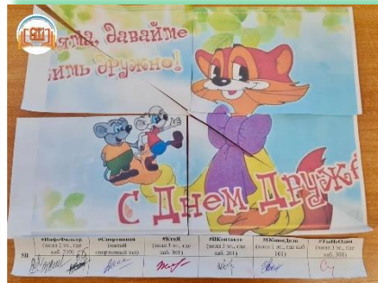
Зиминское городское муниципальное образование