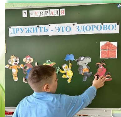
ГОКУ ИО «Специальная (коррекционная) школа № 33 г. Братска»