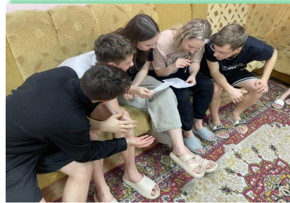
ГБПОУ «Иркутский областной колледж культуры»