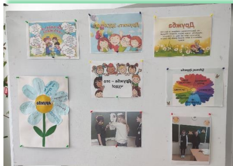
ГОКУ ИО «Специальная (коррекционная) школа р.п. Усть-Уда»