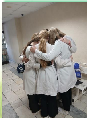
Медицинский колледж железнодорожного транспорта ФГБОУ ВО «ИрГУПС»