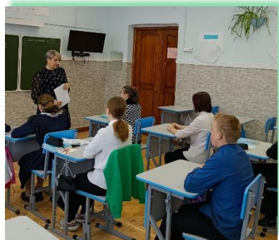
ГОКУ ИО «Специальная (коррекционная) школа № 1 г. Черемхово»