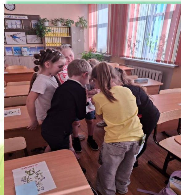
ЧОУ «РЖД лицей № 13» г. Вихоревка