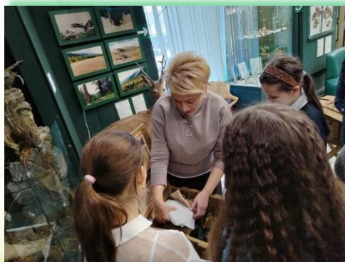
ГОКУ ИО «СКШИ для обучающихся с нарушениями зрения №8 г. Иркутска»