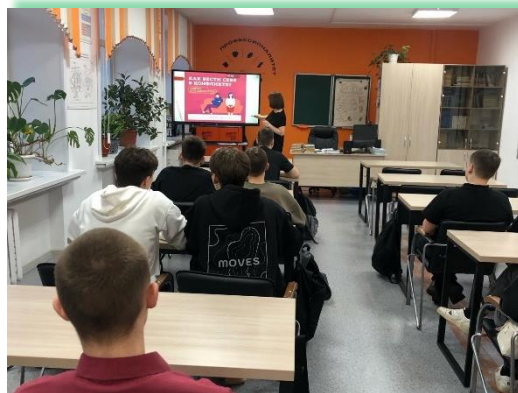
ГАПОУ ИО «Братский индустриально- металлургический техникум»