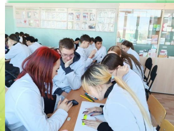
ОГБПОУ «Черемховский медицинский техникум им. Туршевой А.А.»