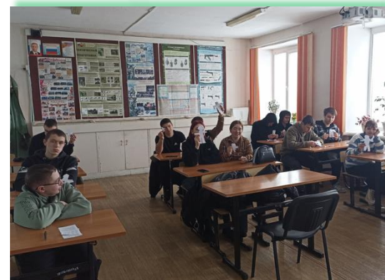
ГАБПОУ ИО «Нижегородский техникум железнодорожного транспорта»