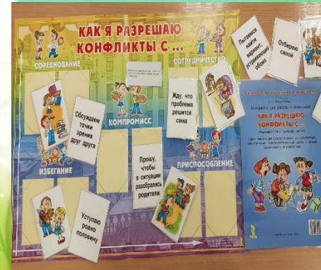
Муниципальное образование «Слюдянский район»