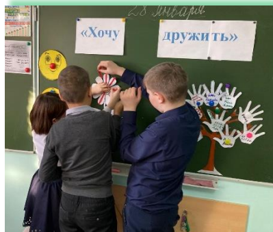
ГОКУ ИО «Специальная (коррекционная) школа г. Киренска»