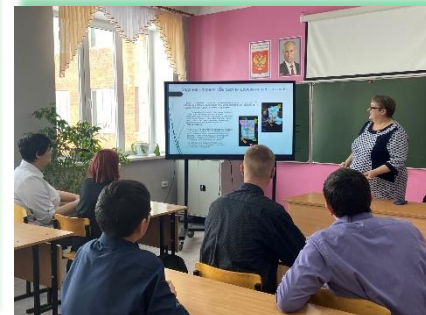
Муниципальное образование «Аларский район»