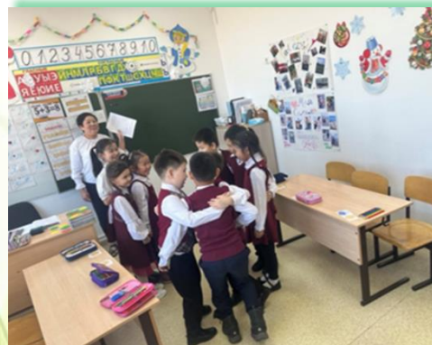
Ольхонское районное муниципальное образование