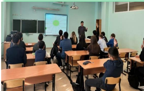
Муниципальное образование «Баяндаевский район»