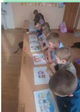
Муниципальное образование Балаганский район