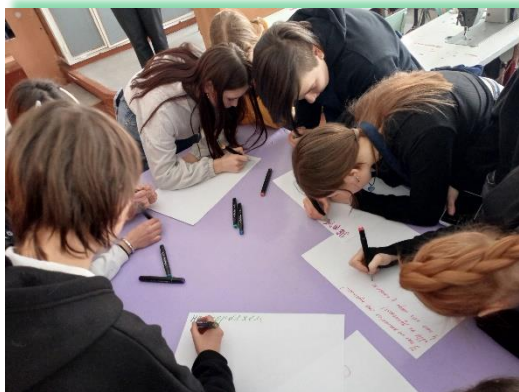
ГБПОУ ИО «Черемховский техникум промышленной индустрии и сервиса»