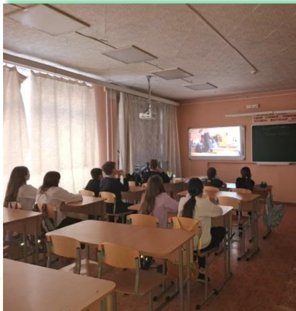
ФГКОУ «Средняя общеобразовательная школа № 178»