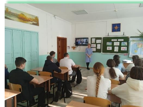
ГОКУ ИО «Специальная (коррекционная) школа № 28 г. Тулуна»