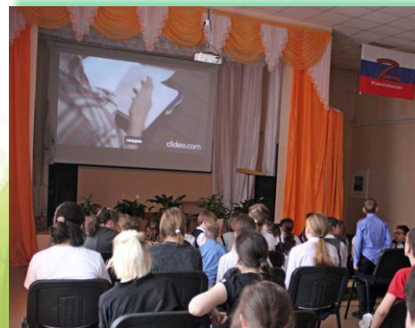
ГОБУ ИО «СКШИ для обучающихся с нарушениями слуха №9 г. Иркутска»