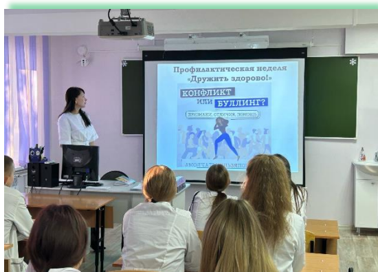
ОГБПОУ «Саянский медицинский колледж»