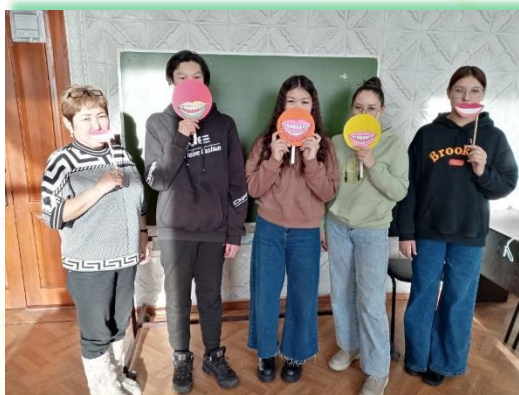
ГБПОУ ИО «Усть-Ордынский аграрный техникум»