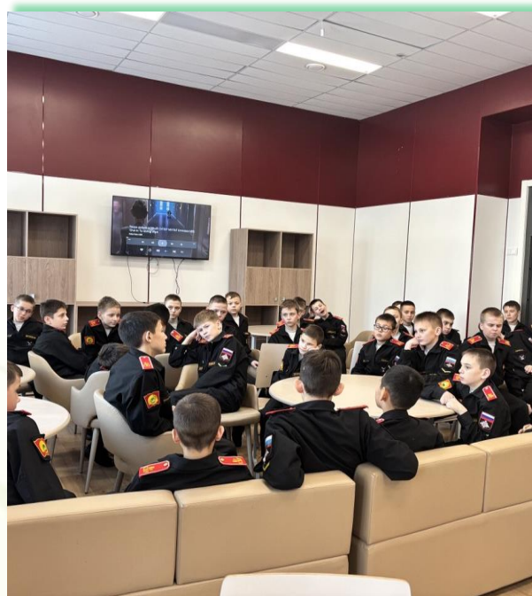
ФГКОУ «Иркутское суворовское военное училище»