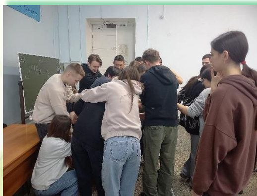
ГБПОУ ИО «Иркутский авиационный техникум»