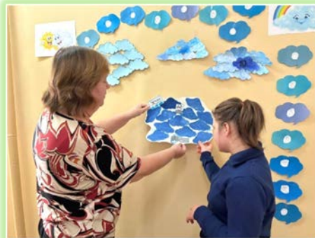
ГОКУ ИО «Специальная (коррекционная) школа г. Усть- Илимска»