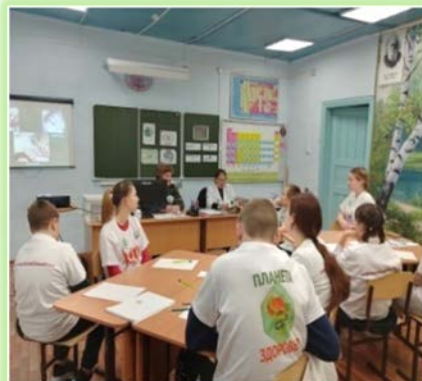
Муниципальное образование «Катангский район»