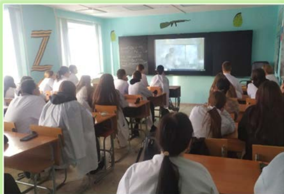
ОГБПОУ ИО «Нижнеудинский медицинское училище»