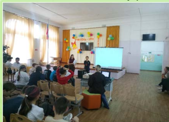
ГОКУ ИО «Специальная (коррекционная) школа для обучающихся с нарушениями речи № 11 г. Иркутска»