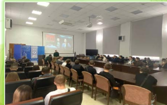
Сибирский колледж транспорта и строительства ФГБОУ ВО «ИРГУПС»