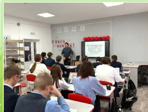
Иркутское районное муниципальное образование