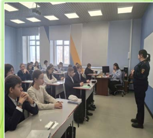
ЧОУ «РЖД лицей № 13» г. Вихоревка