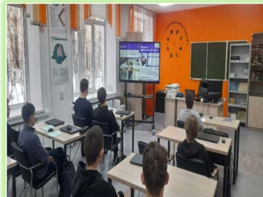
ГАПОУ ИО «Братский индустриально- металлургический техникум»