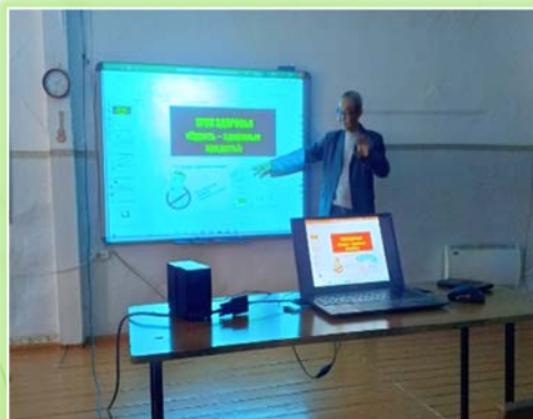
Муниципальное образование «Баяндаевский район»