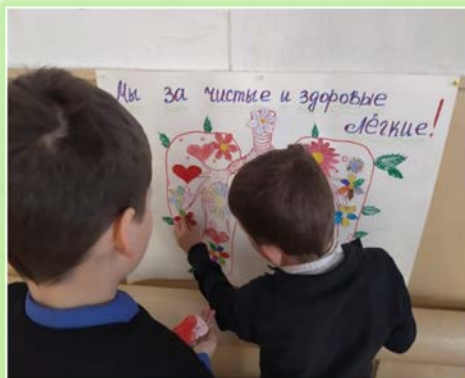
Муниципальное образование Балаганский район