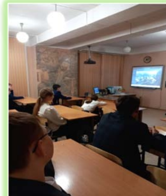
Муниципальное образование «город Усолье-Сибирское»