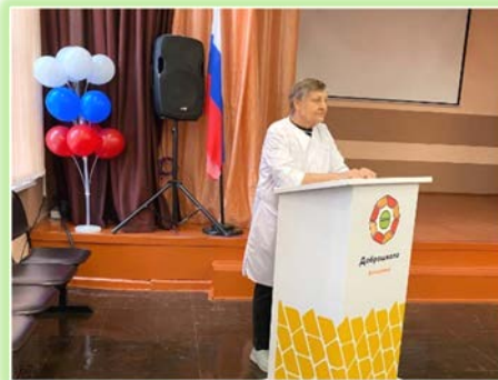
ГОКУ ИО «СКШИ для обучающихся с нарушениями зрения №8 г. Иркутска»