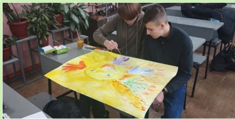
ГАПОУ ИО «Усольский индустриальный техникум»