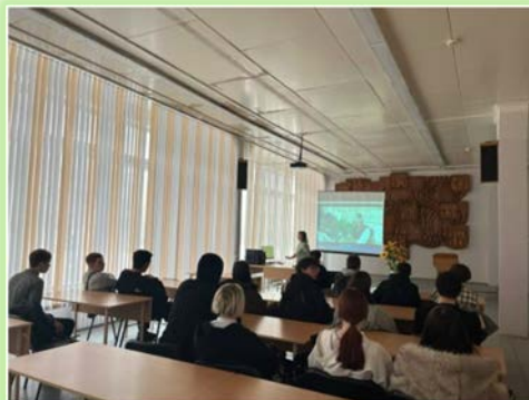
ФГБПОУ «Братский целлюлозно-бумажный колледж»