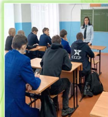
Муниципальное образование «город Тулун»