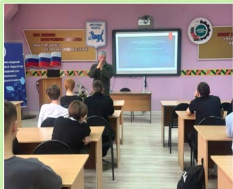
ГБПОУ ИО «Ангарский индустриальный техникум»