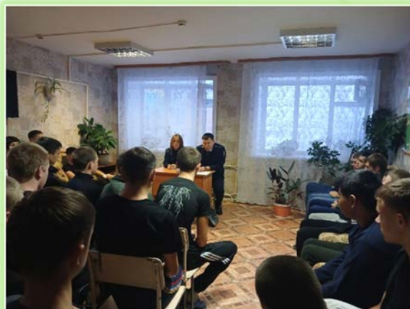
ГАПОУ ИО «Заларинский агропромышленный техникум»