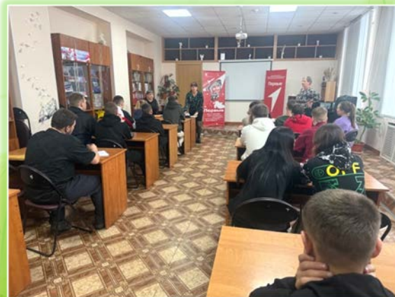
ГБПОУ ИО «Техникум отраслевых технологий и сервиса п. Подгорный»