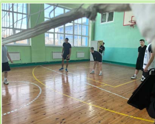
ГБПОУ ИО «Иркутский колледж автомобильного транспорта и дорожного строительства»