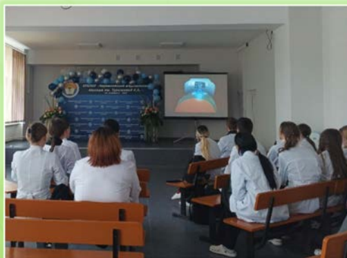
ОГБПОУ ИО «Черемховский медицинский колледж им. Туршиевой А.А.»