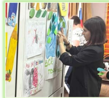
ГОКУ ИО «Специальная (коррекционная) школа № 7 г. Иркутска»