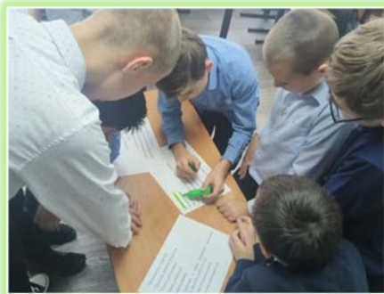
ГОКУ ИО «Специальная (коррекционная) школа г. Киренска»