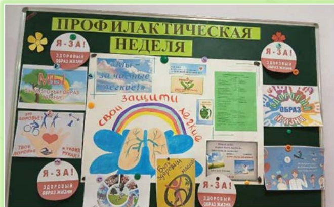
ГОКУ ИО «Специальная (коррекционная) школа г. Вихоревка»