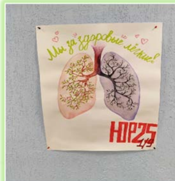
ФГБОУ ВО (Колледж) Иркутский институт (филиал) ФГБОУ ВО «ВГУЮ»