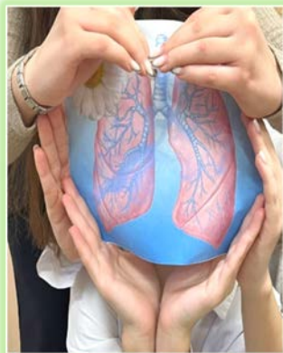
Районное муниципальное образование «Усть-Удинский район»