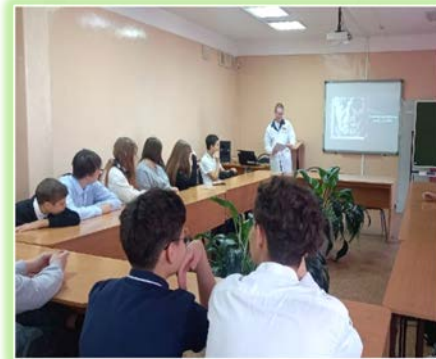
ОГБПОУ ИО «Иркутский базовый медицинский колледж»