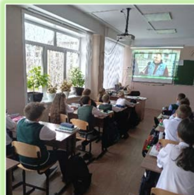
Муниципальное образование «город Саянск»