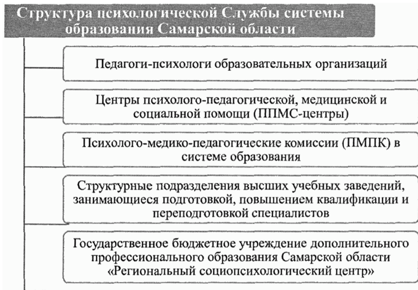
Рис. 3. Структура психологической Службы системы образования Самарской области

На территории большинства территориальных управлений Министерства образования и науки Самарской области действуют ППМС-центры (16 центров). Психолого-педагогическое сопровождение общеобразовательных учреждений осуществляется аналогично, на условиях аутсорсинга, по договору о безвозмездном оказании психолого-педагогических услуг.