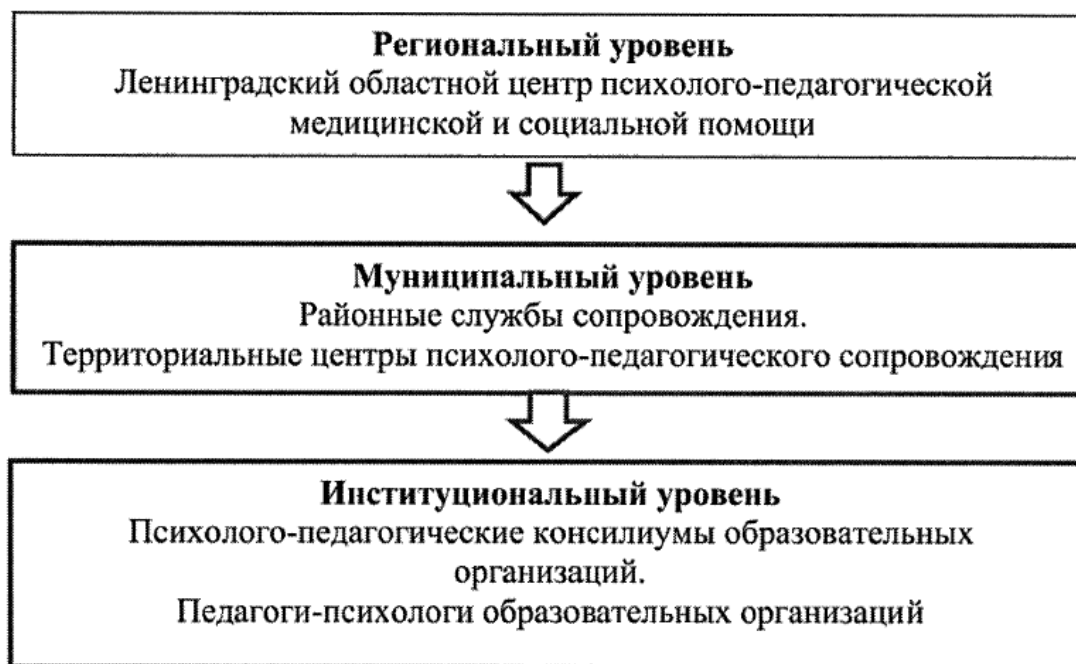
Рис. 7. Трехуровневая система психолого-педагогического сопровождения

организационно-функциональная трехуровневая система комплексного сопровождения. Модель описывает территориально-организационную подчиненность педагогов-психологов, их профессиональный и количественный состав.