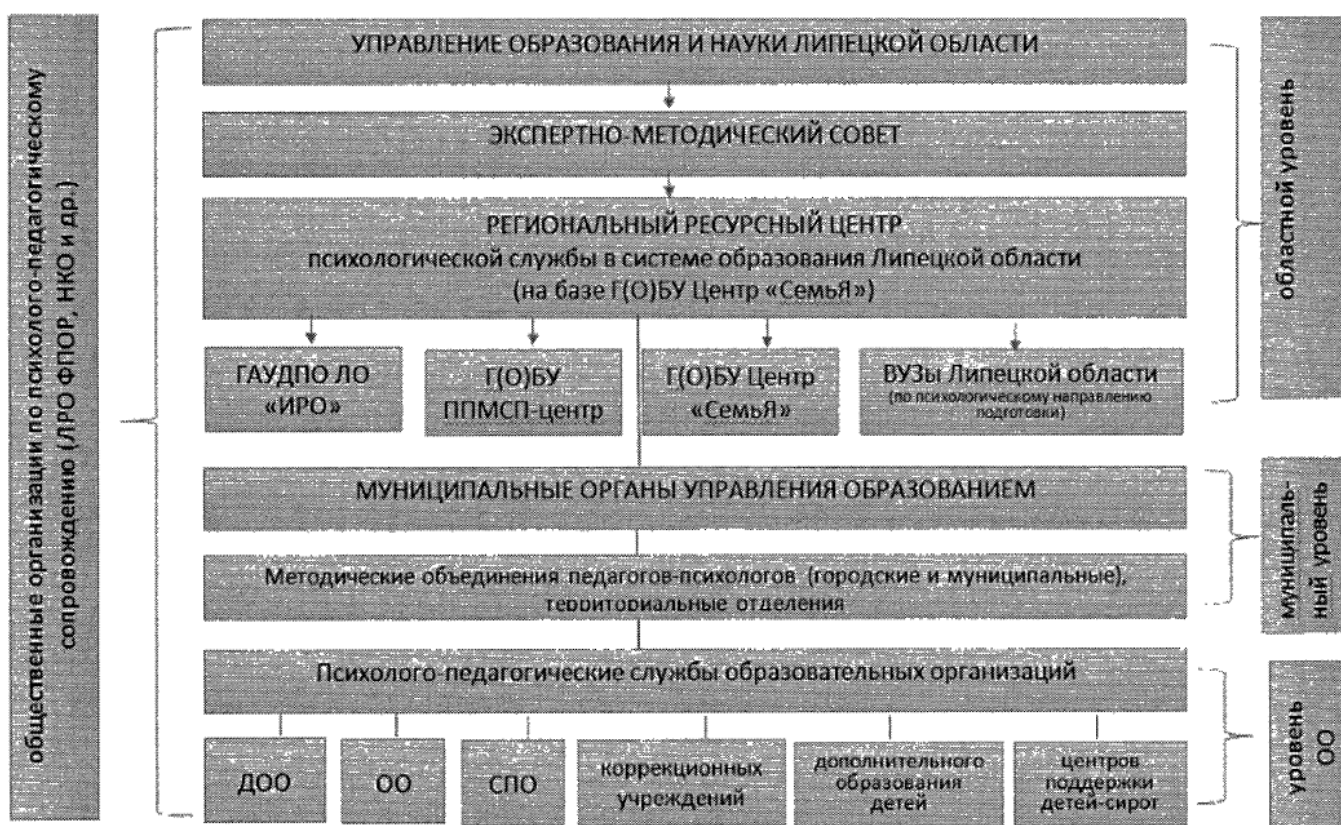
Рис. 6. Модель психологической службы в системе образования Липецкой области

Структура модели службы в системе образования Липецкой области представлена на рисунке 7.