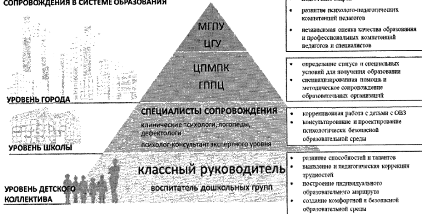
Рис. 1. Модель психолого-педагогической службы города Москвы