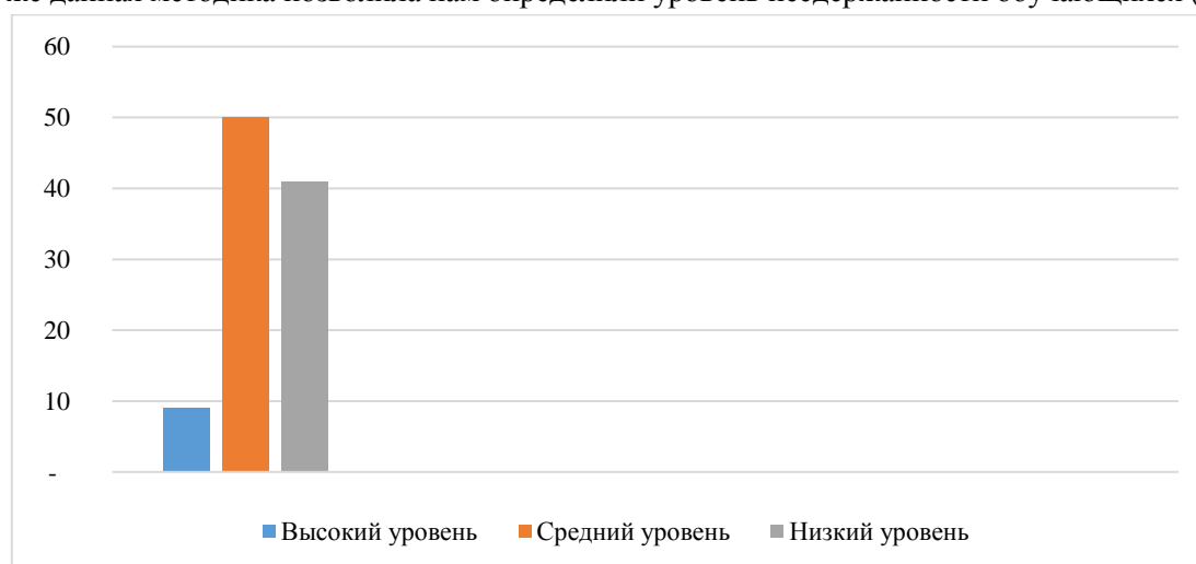
Рисунок 2 – Уровни несдержанности обучающихся (%)

Так же данная методика позволила нам определить уровень несдержанности обучающихся (рисунок 2).