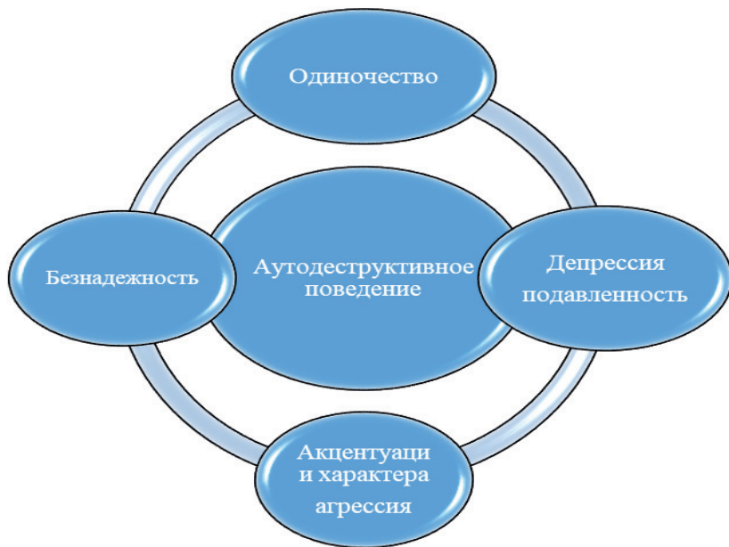
Рисунок 2. Актуальные и потенциальные факторы риска аутодеструктивного поведения.