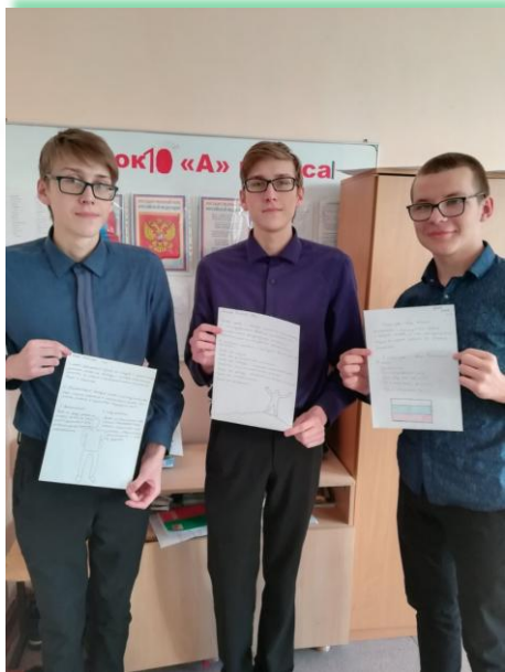
ГОКУ ИО «Специальная (коррекционная) школа-интернат для обучающихся с нарушениями зрения № 8 г. Иркутска»