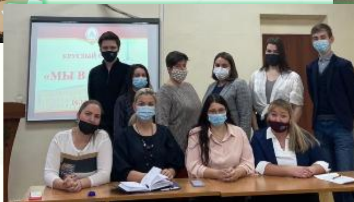
ГБПОУ ИО «Ангарский политехнический техникум»