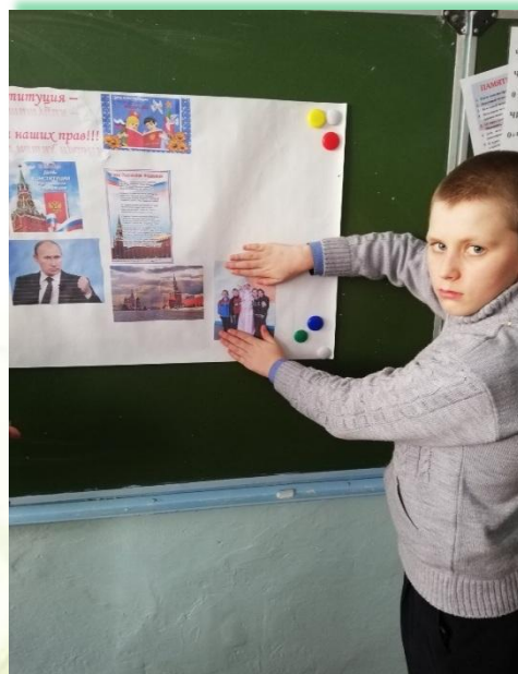
ГОКУ ИО для детей-сирот и детей, оставшихся без попечения родителей «Специальная (коррекционная) школа-интернат № 6 г. Нижнеудинска»