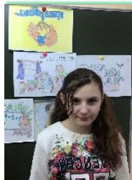
ГОКУ ИО «Специальная (коррекционная) школа № 33 г. Братска»