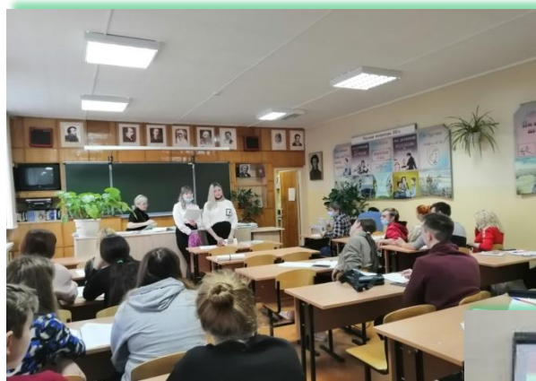
ГБПОУ ИО «Братский педагогический колледж»