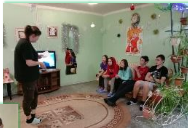
ГАПОУ ИО «Байкальский техникум отраслевых технологий и сервиса»