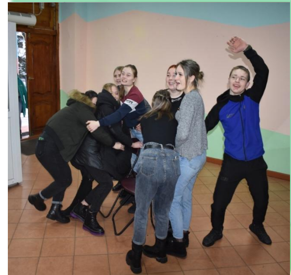
ГБПОУ ИО «Профессиональное училище № 48 п. Подгорный»