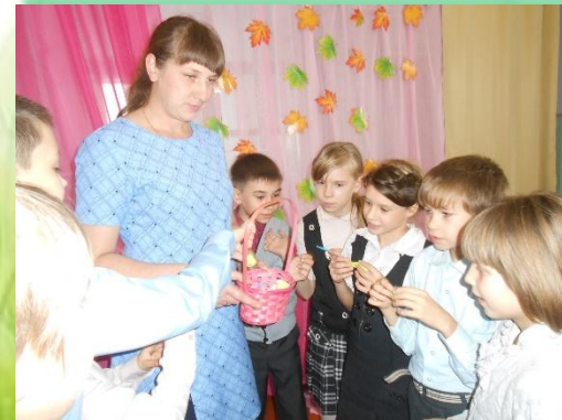
ГОКУ ИО «Специальная (коррекционная) школа №1 г. Черемхово»