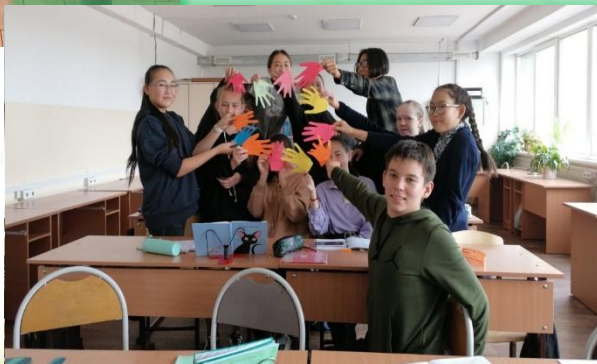
Муниципальное образование «Нукутский район»