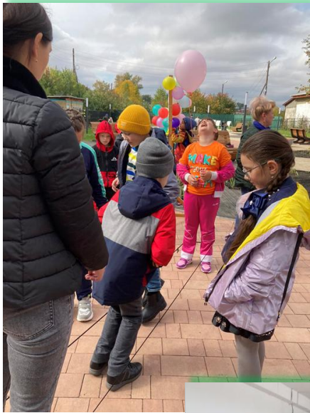
Муниципальное образование - «город Тулун»

муниципальные общеобразовательные организации Иркутской области