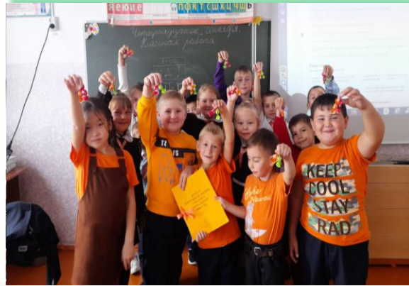
Муниципальное образование «Боханский район»