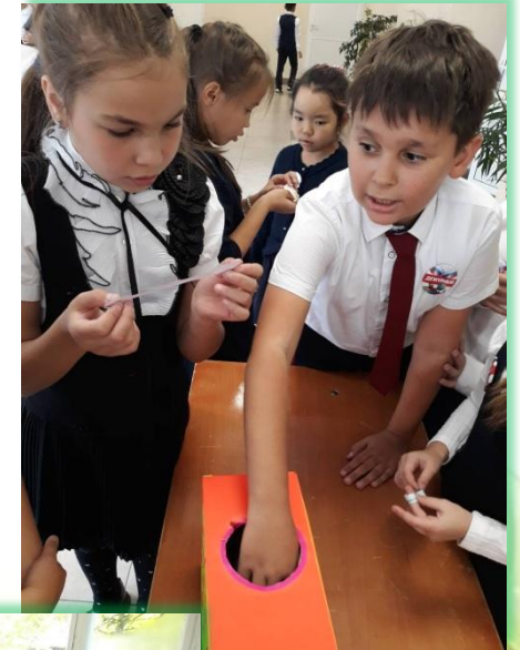
Иркутское районное муниципальное образование