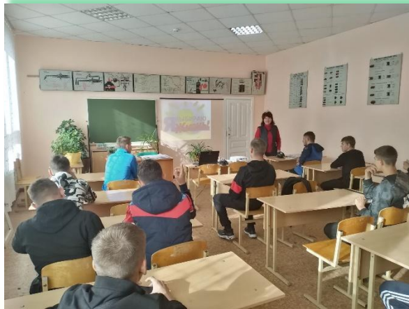
ГАПОУ ИО «Усольский аграрно-промышленный техникум»