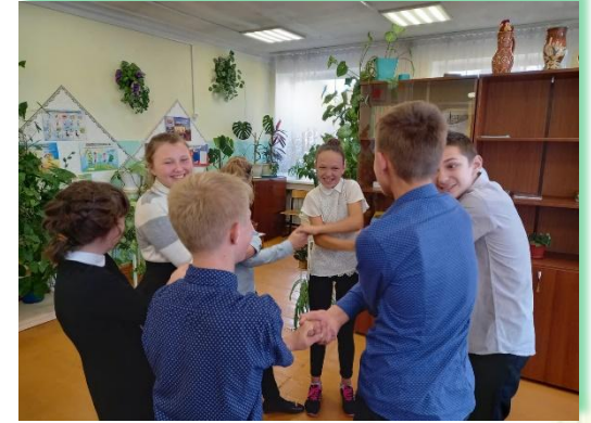
ГОКУ ИО «Специальная (коррекционная) школа г. Бодайбо»