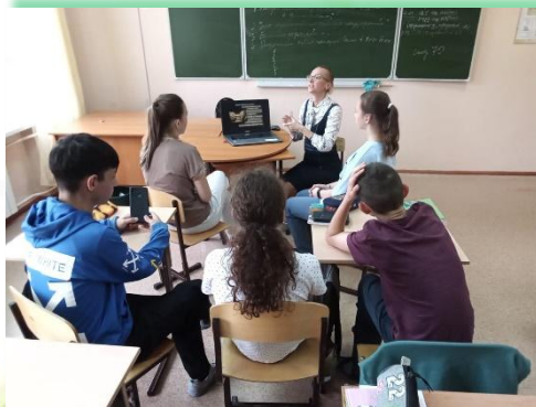
ГОКУ ИО «Специальная (коррекционная) школа-интернат для обучающихся с нарушениями слуха № 9 г. Иркутска»