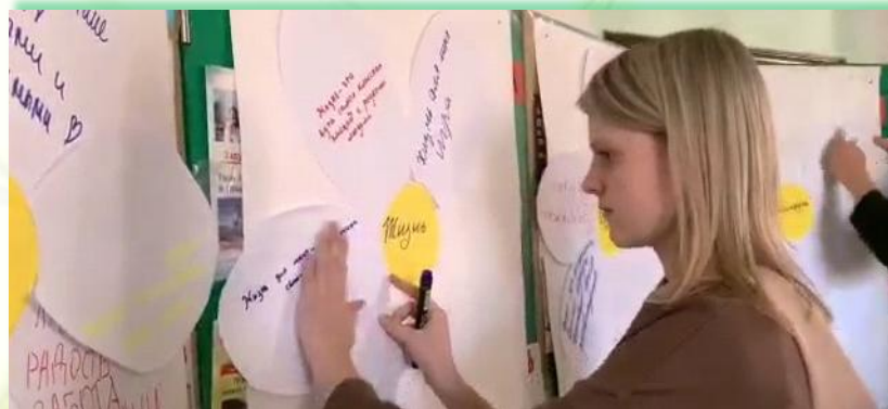
ГАПОУ ИО «Черемховский горнотехнический колледж им. М.И. Щадова»