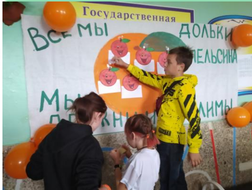
ГОКУ ИО «Санаторная школа-интернат №4 г. Усолье-Сибирское»

Государственные образовательные организации для детей, нуждающихся в государственной поддержке