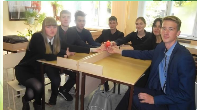
Муниципальное образование Иркутской области «Казачинско-Ленский район»