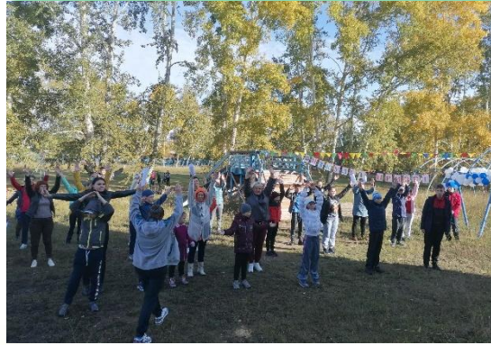
ГОКУ ИО «Специальная (коррекционная) школа №33 г. Братска»