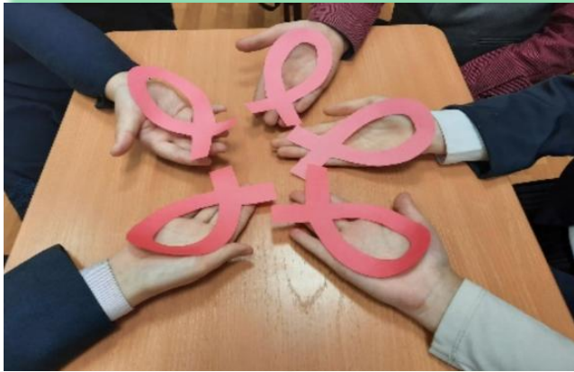
ГОКУ ИО «Специальная (коррекционная) школа №2 г. Черемхово»