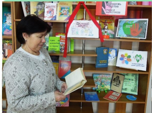
ГОКУ ИО «Специальная (коррекционная) школа г. Усть-Илимска»