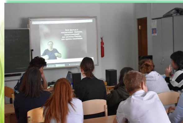
ГОКУ ИО «Специальная (коррекционная) школа-интернат для обучающихся с нарушениями слуха № 9 г. Иркутска»