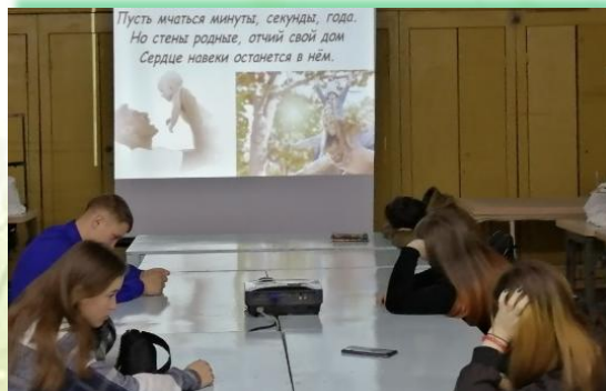
ГАПОУ ИО «Байкальский техникум отраслевых технологий и сервиса»