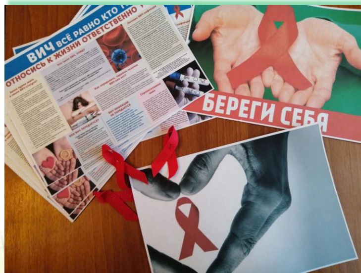
ФГКОУ «Средняя общеобразовательная школа № 178»