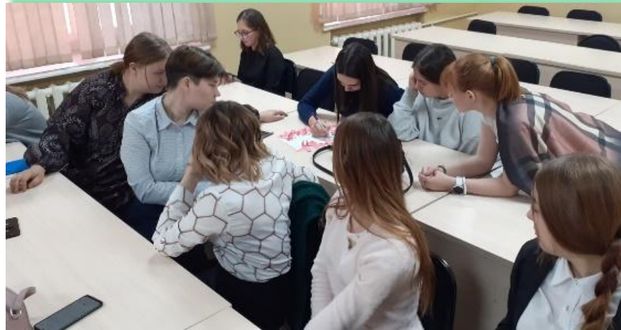
ГБПОУ ИО «Зиминский железнодорожный техникум»