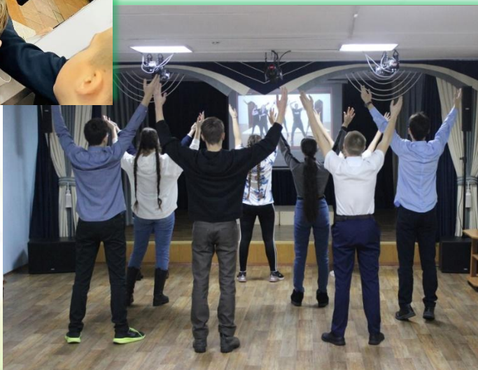
ЧОУ «Школа-интернат №25 среднего общего образования ОАО «РЖД» г. Вихоревка