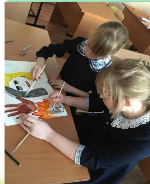
Зиминское городское муниципальное образование