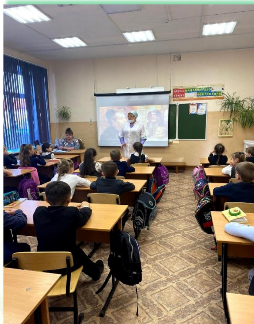
Муниципальное образование «Слюдянский район»