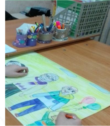
ГОКУ ИО «Специальная (коррекционная) школа – интернат № 6 г. Зима»