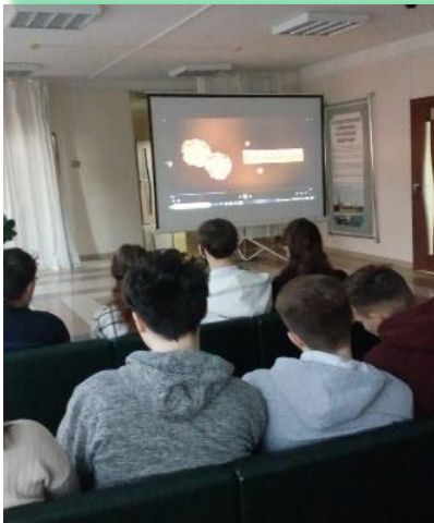
ГАПОУ ИО «Иркутский технологический колледж»