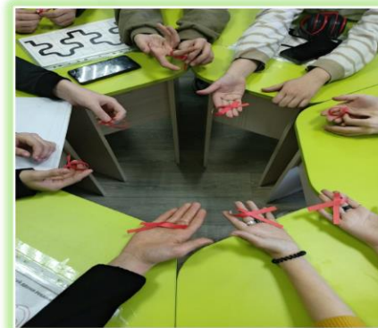
ГОКУ ИО «СКШИ № 6 г. Нижеудинска»