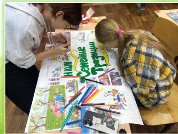
ГОКУ ИО «СКШИ для обучающихся с нарушениями зрения № 8 г. Иркутска»