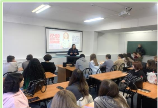
ЧПОУ «Ангарский экономико-юридический колледж»