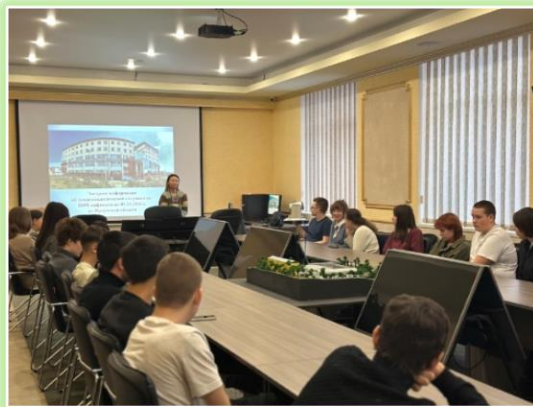
ГБПОУ ИО «Иркутский колледж автомобильного транспорта и дорожного строительства»