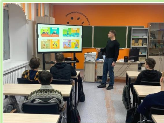
ГАПОУ ИО «Братский индустриально- металлургический техникум»