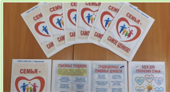
ГОКУ ИО «СКШ № 1 г. Черемхово»