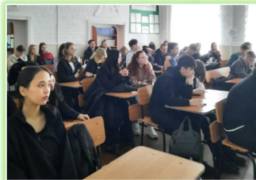
ЧПОУ «Байкальский колледж права и предпринимательства»