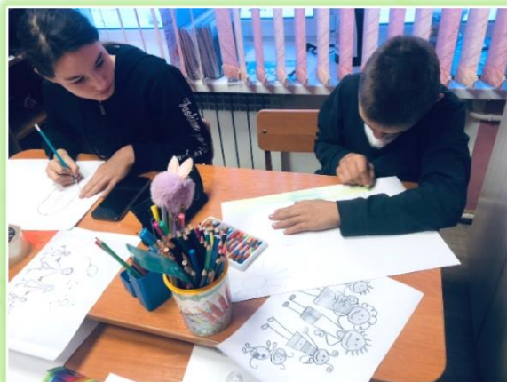
Муниципальное образование «Нижнеудинский район»