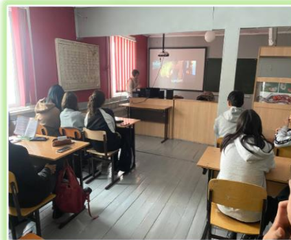
Муниципальное образование «Баяндаевский район»