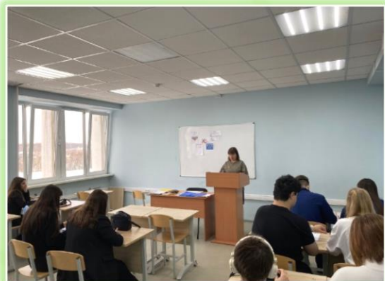
Колледж Иркутского института (филиала) ВГУЮ (РПА Минюст России)