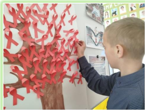
Муниципальное образование «Жигаловский район»