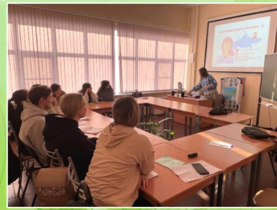
ГАПОУ ИО «Иркутский техникум индустрии питания»