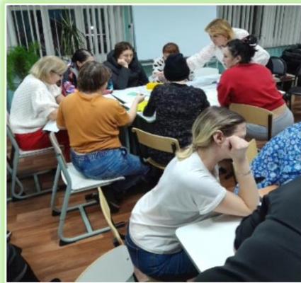
ГОКУ ИО «СКШИ г. Киренска»