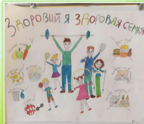
Муниципальное образование Куйтунский район