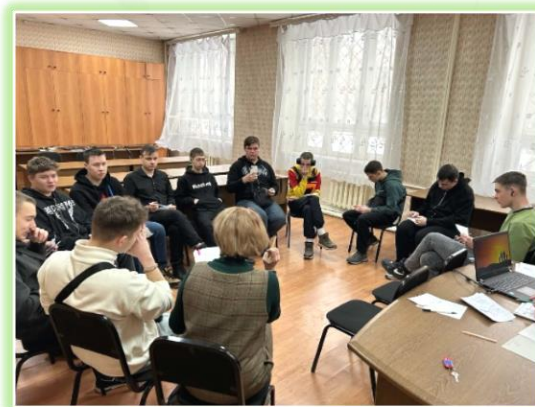
ГАПОУ ИО «Усольский индустриальный техникум»