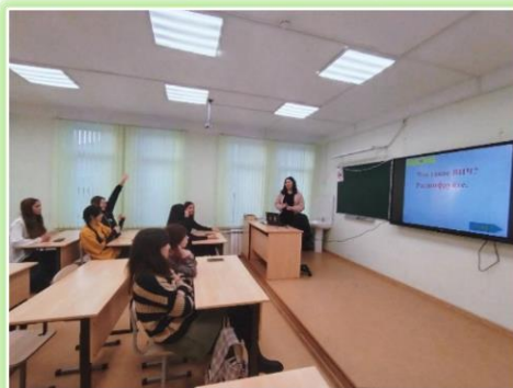
Муниципальное образование Балаганский район