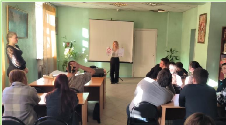
ГБПОУ ИО «Черемховский техникум промышленной индустрии и сервиса»