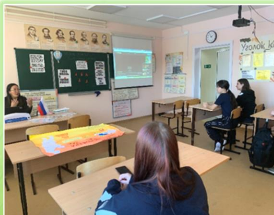
Ольхонское районное муниципальное образование