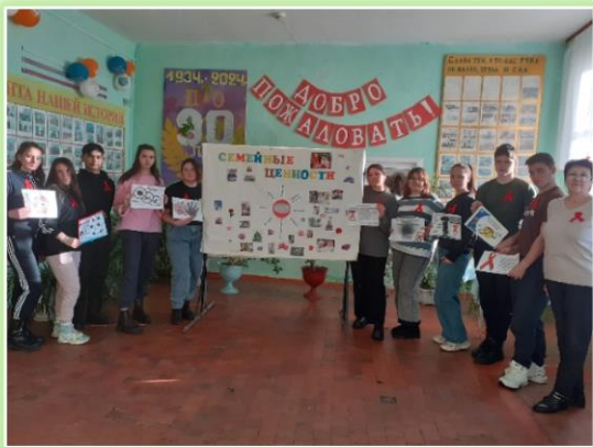
ГАПОУ ИО «ЗАПТ» УПО «Кутулик» Аларский район