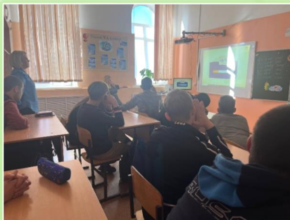
ГОКУ ИО «СКШ № 3 г. Иркутска»