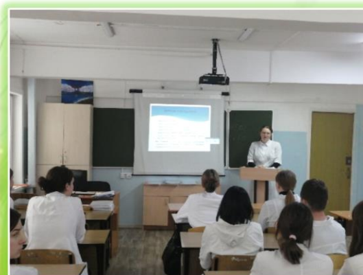
ОГБПОУ «Саянский медицинский колледж»